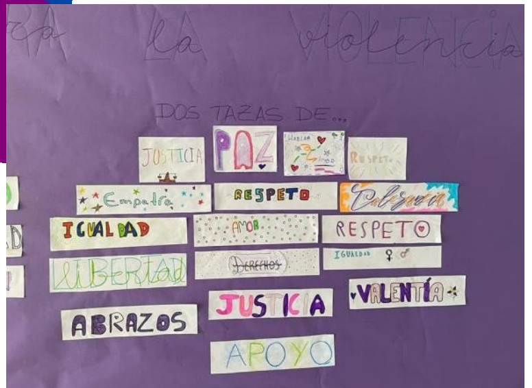
Αφίσες: Open Society Day