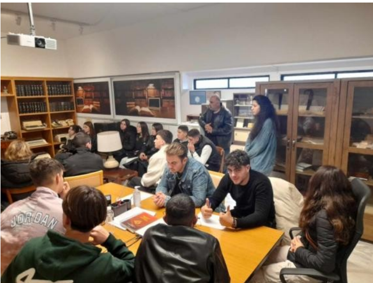
Συνεργασία με μαθητές από άλλα σχολεία της πόλης