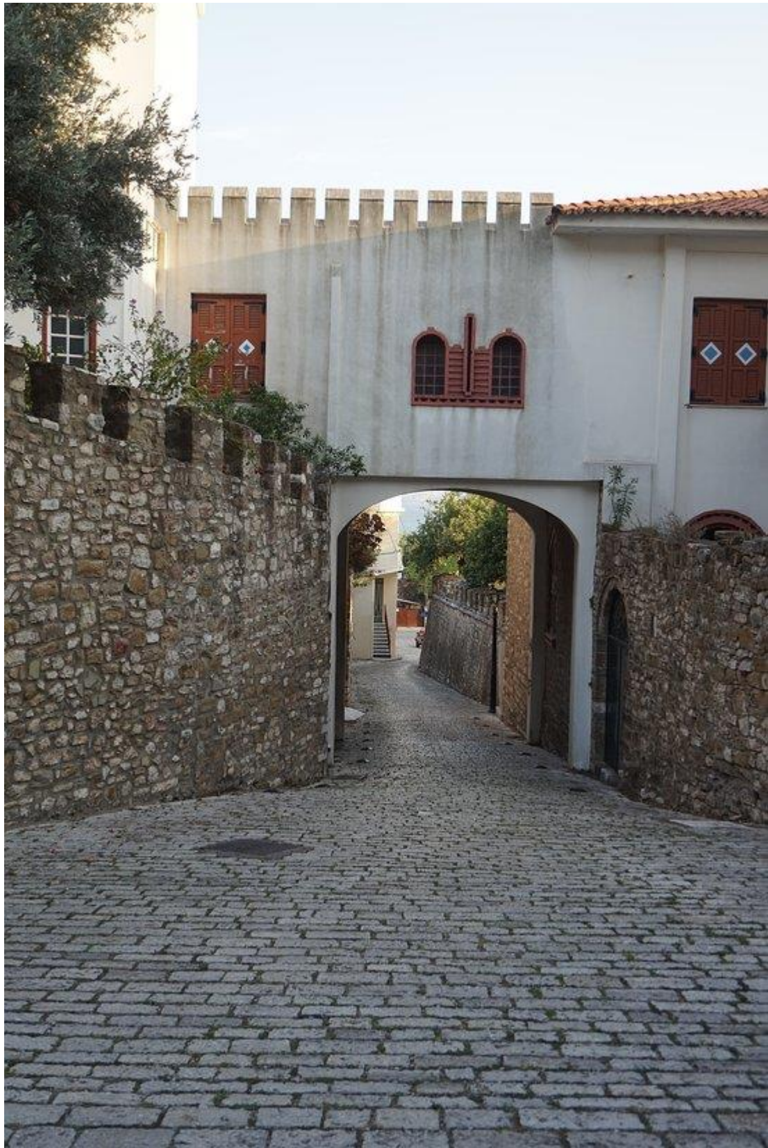
Ο πύργος του Μάρκου Μπότσαρη