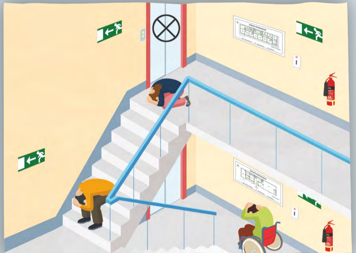
Αποφυγή μετακίνησης. Μείωση του ύψους και κάλυψη