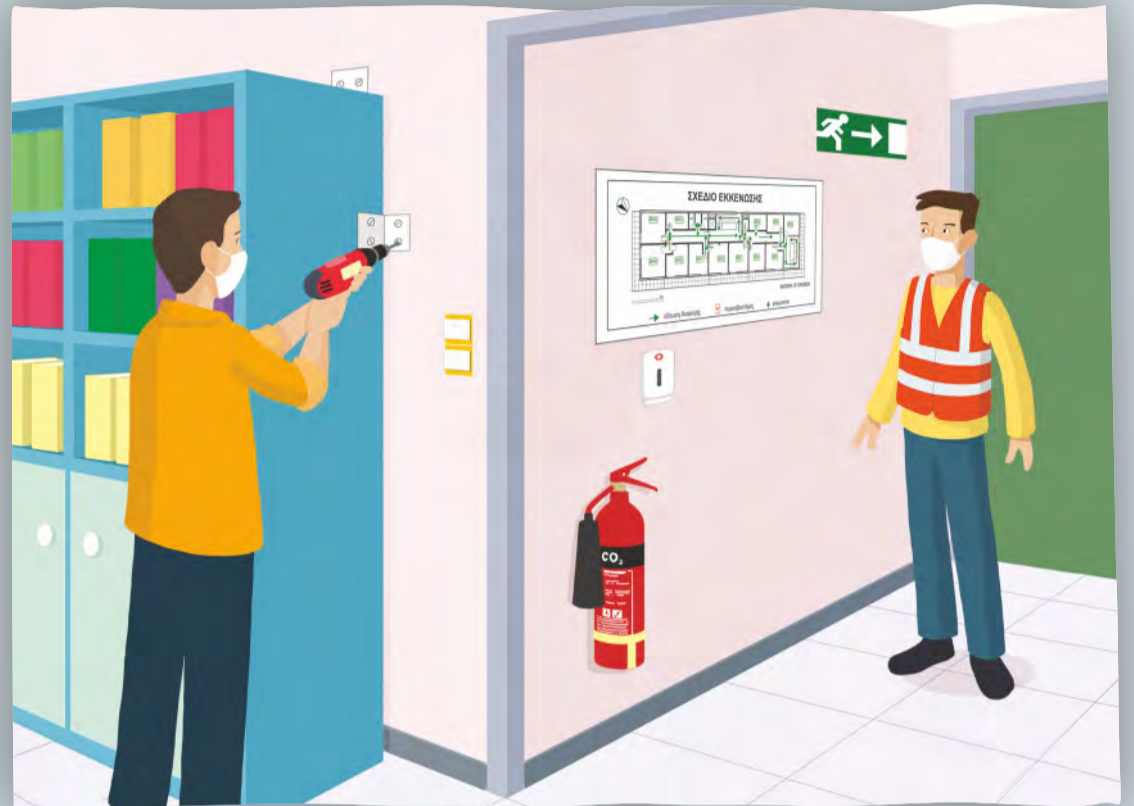
Επισήμανση και άρση επικινδυνότητας