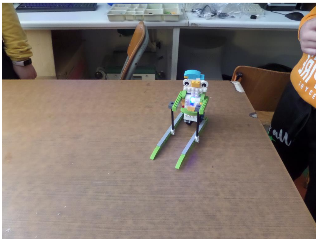
Ο χιονάνθρωπος που κάνει σκι