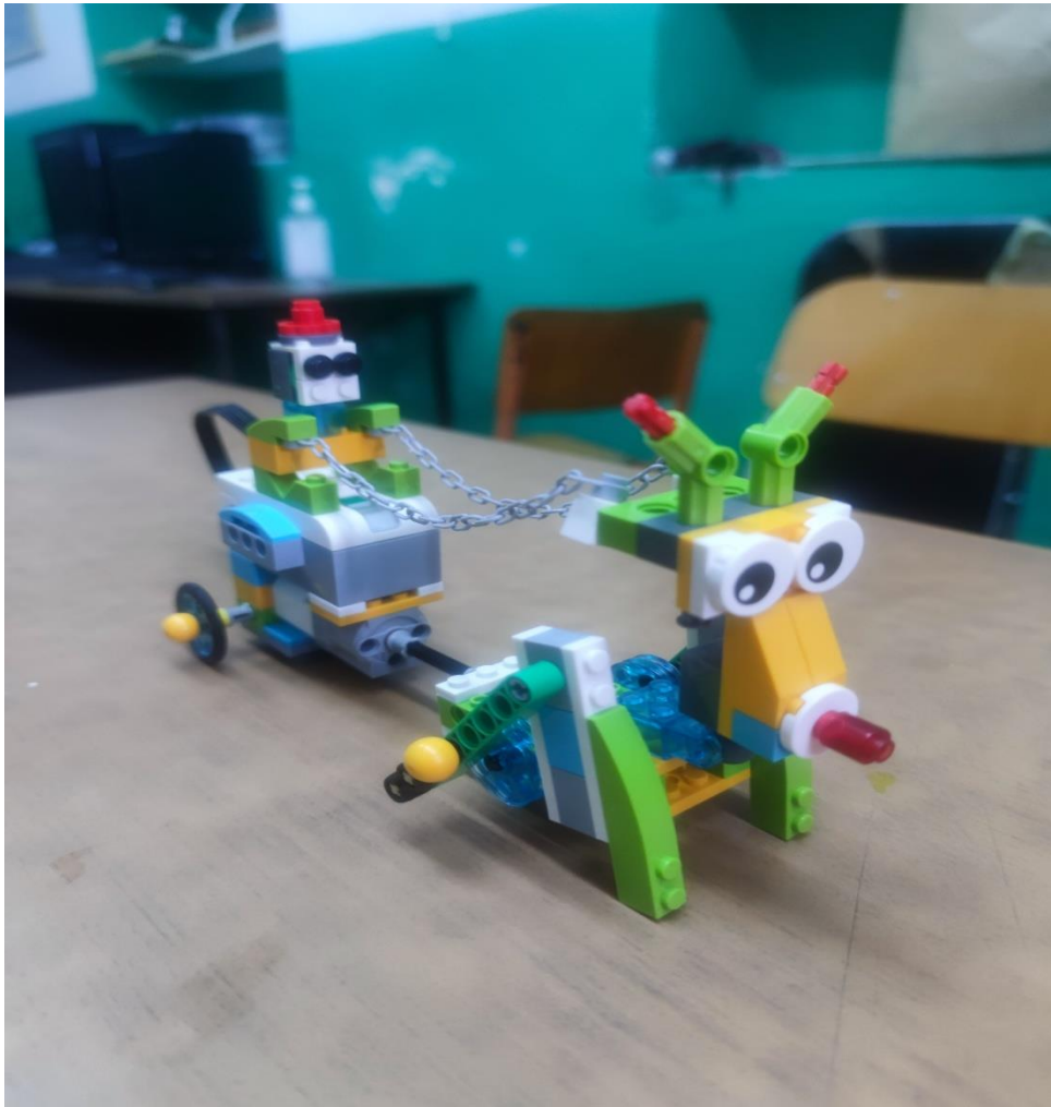
Το έλκηθρο του Άη Βασίλη