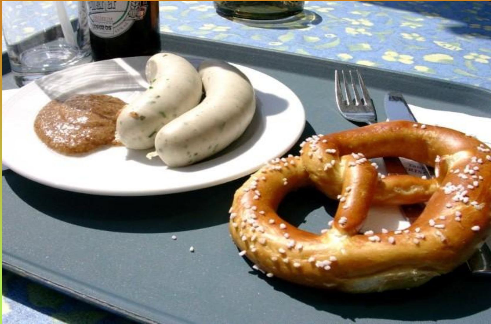
Πρέτσελ, «Λευκό» λουκάνικο και μουστάρδα