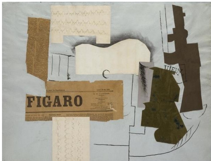
Πάμπλο Πικάσο, Μπουκάλι Vieux Marc, Γυαλί, Κιθάρα και Εφημερίδα (1913)