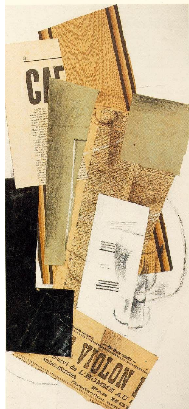
Γουαλί, Καράφα και Εφημερίδες (1914)