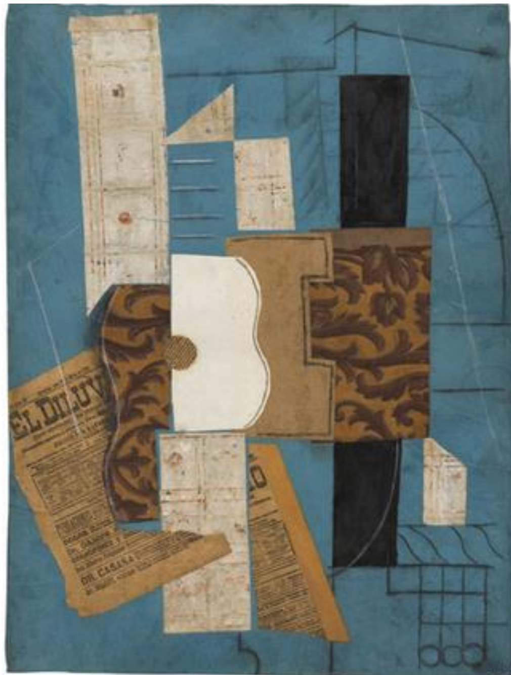
Πάμπλο Πικάσο, Κιθάρα, (1913)