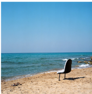
Αγγελική Σβωρόνου, A chair with a view