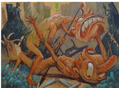
Ιάκωβος Βάης, Αιτίλο