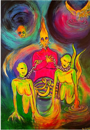
Γεωργία Καλογεροπούλου, Νερό και Γη, Φωτιά και Αέρας