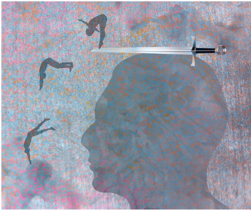
Βούλα Παρασκευή Φερεντινού, Η πτώση