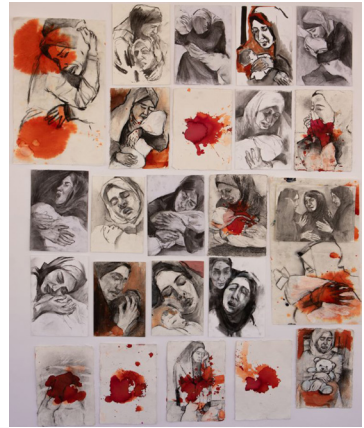
Κατερίνα Καλαντζίδου, Μάνες της Γάζας