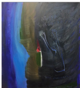
Βασιλική Κοσκινιώτου, Άτοσσα πολεμόχαρη