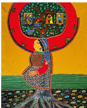
Ελένη Πεχλιβάνη, Ποτέ ξανά