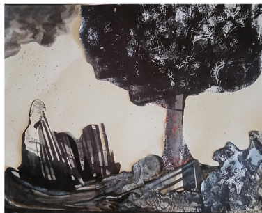
Σοφία Χουλιαρά, Perseptosis