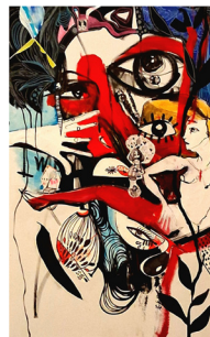
Έλλη Γρίβα, Ορυμαγδός