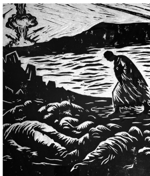
Μάρκος Ευλογημένος, Ξέρξης