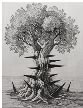
Γιάννης Γαλαίος, Η ελιά και οι σικιές