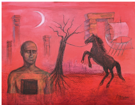
Ρένα Αβαγιανού, Το σκοτάδι μέσα του

Η έκθεση θα είναι ανοιχτή για το κοινό από την Πέμπτη 23/4 έως την Πέμπτη 30/4, ώρες 9:00-13:00, την Τετάρτη 22/4 και την Πέμπτη 30/4, ώρες 18:00-20:00 , ενώ κατά τη διάρκεια του Φεστιβάλ υπάρχουν προγραμματισμένες επισκέψεις σχολείων.