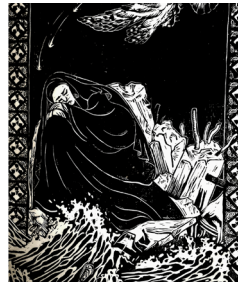
Calliope (Calli) Dolcetti, Το όνειρο της Άτοσσας