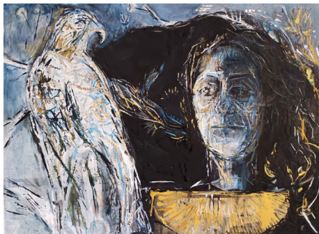
Κατερίνα Ασλανίδου, Απρόσιτη Μητέρα