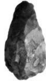
Χειροπέλεκυς από πυριτόλιθο

Τα πρώτα τεχνολογικά δημιουργήματα του ανθρώπου είναι τα πρώτα εργαλεία που άρχισε να κατασκευάζει και να χρησιμοποιεί πριν από 2.000.000 χρόνια. Τα πρώτα αυτά τεχνολογικά επιτεύγματα σηματοδοτούν την αρχή του ανθρώπινου πολιτισμού.