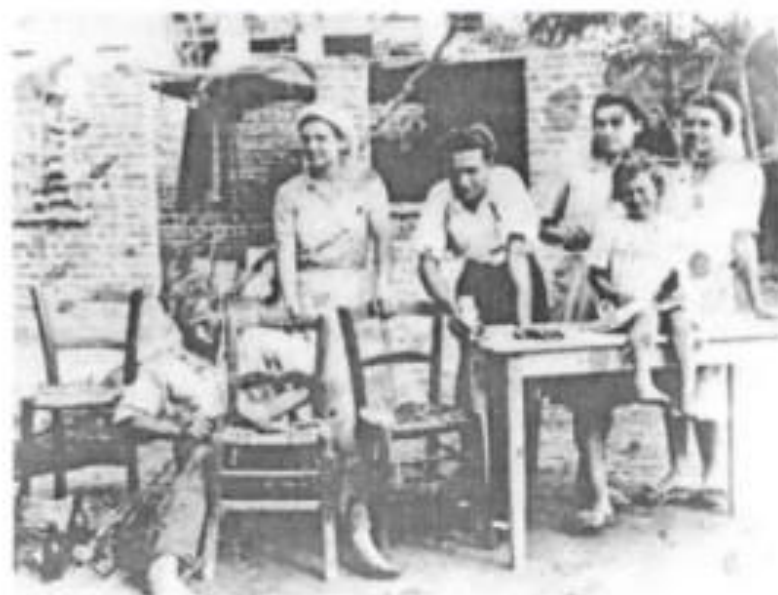
Καρεκλάς «επί το έργον». Έτος 1937 - Χαλάστρα - Θεσσαλονίκη)

Οι καρεκλάδες εκτός από το να φτιάχνουν καρέκλες , επισκεύαζαν τις παλιές και χαλασμένες καρέκλες .