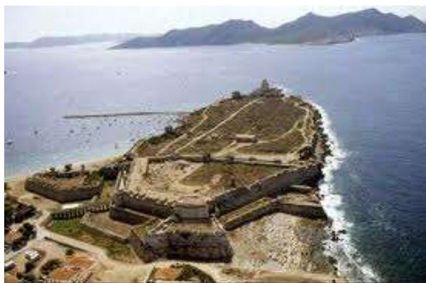
Αεροφωτογραφία του κάστρου

«..... Είναι ένα πολύ ισχυρό κάστρο που στέκεται σ' ένα χαμηλό ακρωτήριο. Η θάλασσα βρέχει περιμετρικά τα θεμέλια των τριών τετάρτων των τειχών. Τα τείχη είναι πολύ ψηλά. Το λιμάνι βρίσκεται στα ανατολικά και για να ελέγχεται το πέρασμα της Σαπιέντζας έχει χτιστεί στο ίδιο επίπεδο με τη θάλασσα ένας στρογγυλέ πύργος που έχει αρκετά μεγάλα κανόνια. Μπροστά από την ξηρά υπάρχει μια «στεγνή» τάφος με βάθος πέντε γιάρδες και περίπου είκοσι γιάρδες πλατιά.....» (Απόσπασμα από τον Άγγλο έμπορο Bernard Randolph , Λονδίνο 1689)