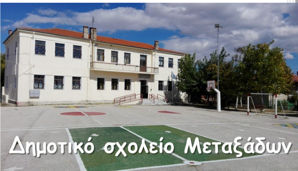
Δημοτικό σχολείο Μεταξάδων