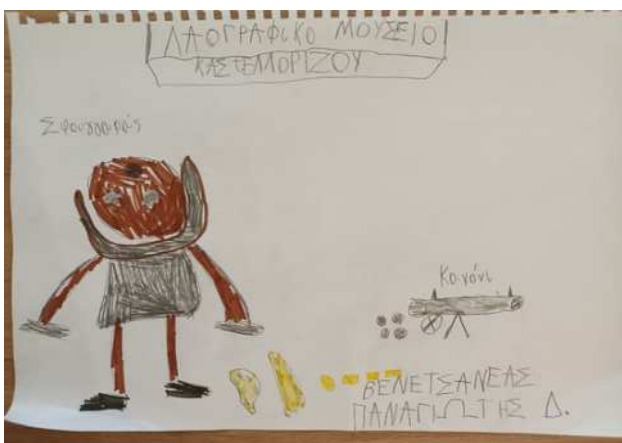
Λαογραφικό Μουσείο Καστελλορίζου (Βενετσάνεας Παναγιώτης)