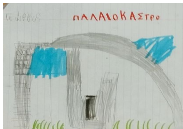
Παλιόκαστρο (Γεωργουδάκης Γιώργος)