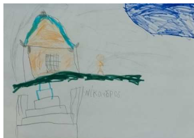
Λυκιακός Τάφος (Μαλτέζος Νίκανδρος)