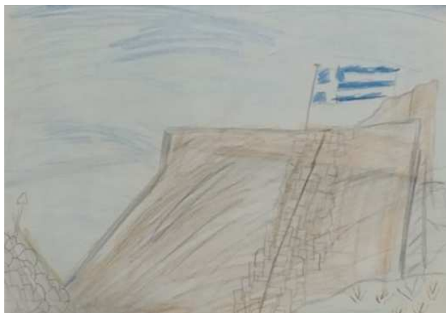
Κάστρο των ιπποτών του Αγίου Ιωάννη (Μαγιάφης Πάρης)