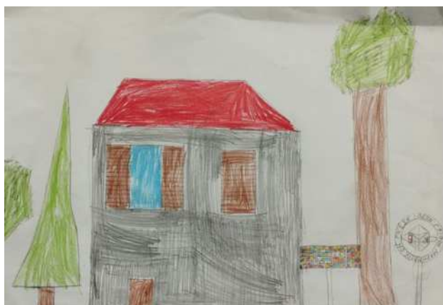
Μουσείο Γρίφων (Μποχώτης Παναγιώτης)