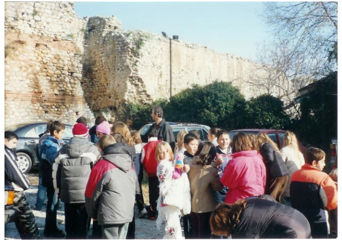
Από την επίσκεψη στα Βυζαντινά τείχη(1/12/06)

Η βυζαντινή Δράμα αποτελεί συνέχεια ενός ρωμαϊκού οικισμού, όπως μαρτυρείται από τα αρχαιολογικά ευρήματα.