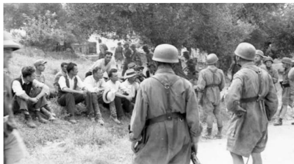
Μαρτυρικό χωριό Κοντομαρί