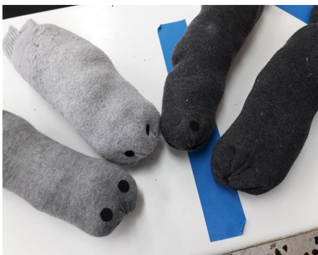
Κατασκευή παιχνιδιού φώκιας