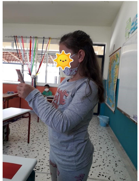
Παιχνίδι με γρίφους