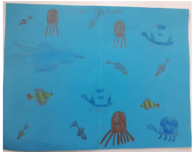
Ζωγραφική με θέμα τον βυθό της Γυάρου