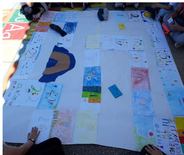
Κατασκευή επιδαπέδιου παιχνιδιού