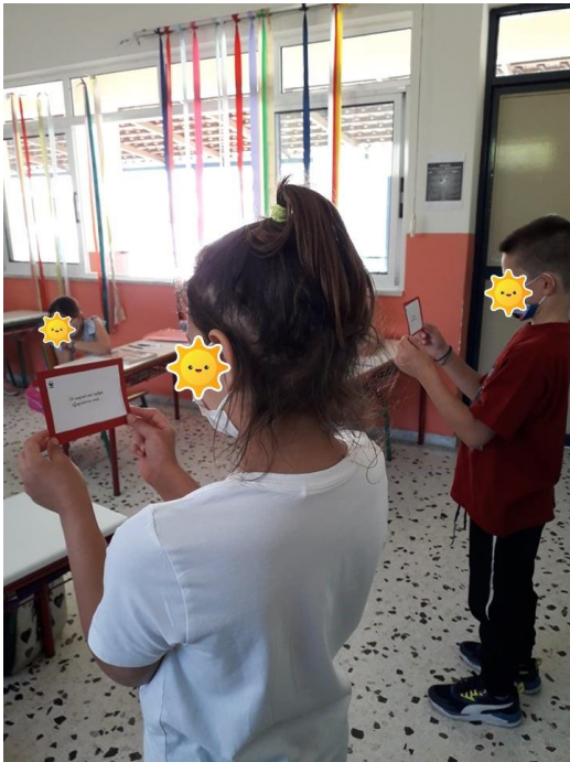
Παιχνίδι με κάρτες