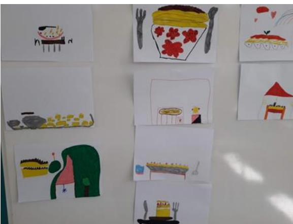
Ζωγραφιές με αγαπημένα φαγητά των μαθητών