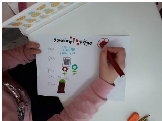
Ζωγραφιές με τροφές από οικοσυστήματα- προέλευση των τροφών