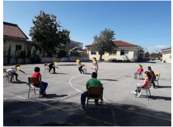
Παιχνίδια ενδυνάμωσης και αποφόρτισης (φρουτοσαλάτα)