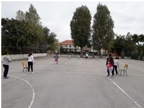
Κινητικό παιχνίδι- Σκυταλοδρομίες που αφορούν στην ανακύκλωση και κομποστοποίηση