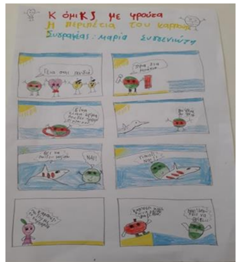
Κόμικς με φρούτα και λαχανικά