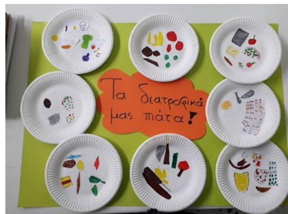
Κολλάζ- Σύνθεση διατροφικού πιάτου