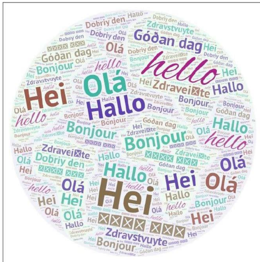
Τάξη ΣΤ" (ομάδα αγοριών)

Με τις τάξεις Ε' και ΣΤ' μιλήσαμε για την Ευρωπαϊκή Ημέρα Γλωσσών και στη συνέχεια τα παιδιά εργάστηκαν σε ομάδες και αναζήτησαν τις παρακάτω λέξεις και εκφράσεις σε διάφορες γλώσσες: Hello, How are you και Good morning . Στη συνέχεια κατασκευάσαμε τα παρακάτω συννεφόλεξα που περιείχαν τις λέξεις που κατέγραψαν τα παιδιά.