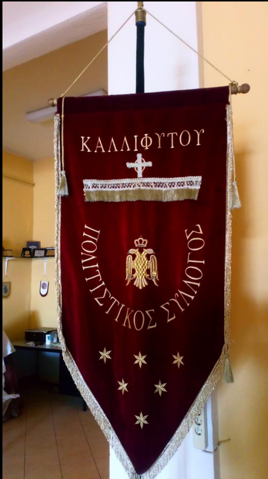
Το λάβαρο του Πολιτιστικού Συλλόγου Καλλιφύτου