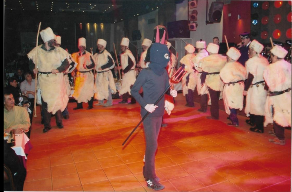
Στη φωτογραφία διακρίνονται ο διάβολος και οι Μωμόγεροι σε κυκλικό χορό