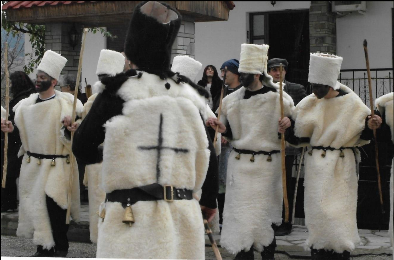
Οι Μωμόγεροι στους δρόμους του χωριού. Στη φωτογραφία φαίνεται ευδιάκριτα ο σταυρός του Ακρίτα