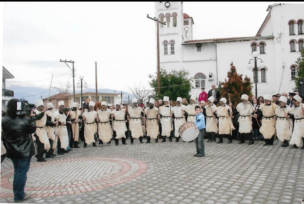
Ο σχηματισμός κύκλου