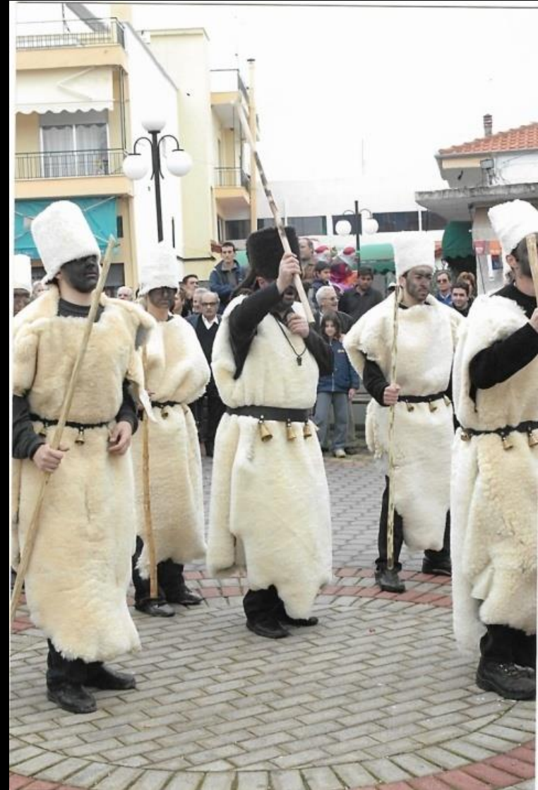
Ο Ακρίτας δίνει το σύνθημα για το σχηματισμό του σταυρού