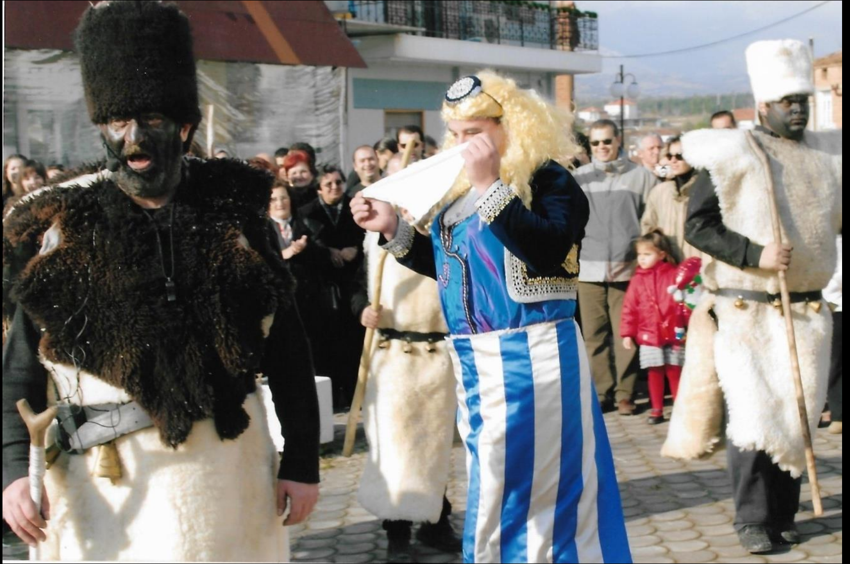
Ο Ακρίτας, η νύφη και οι Μωμόγεροι