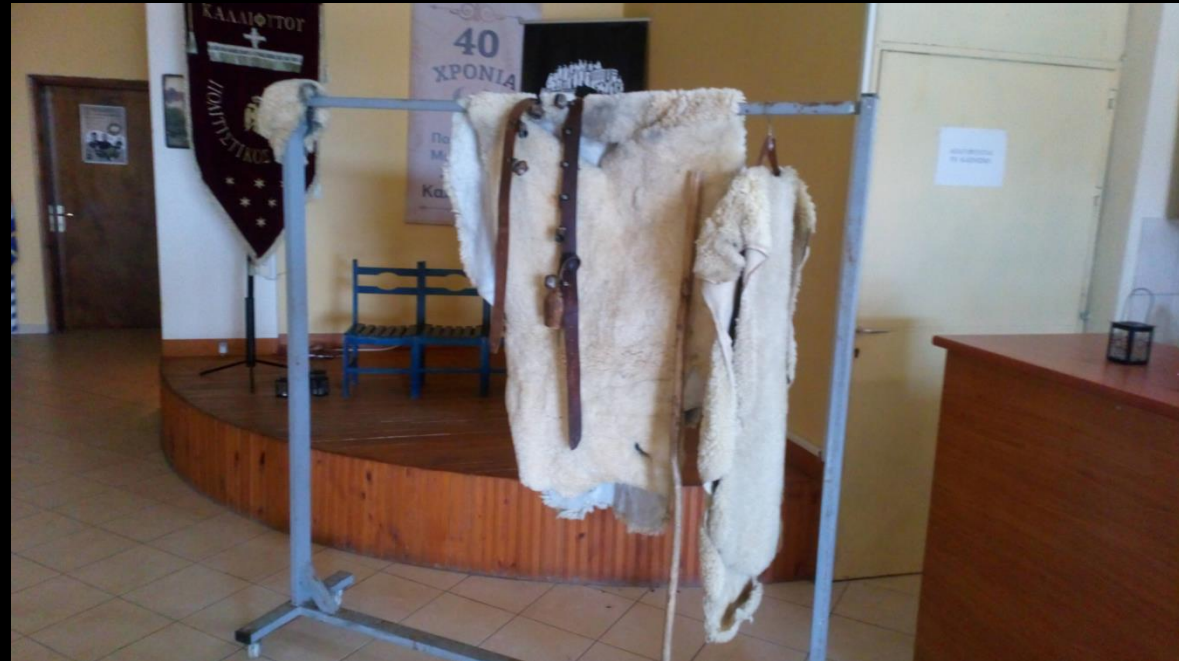
Η έκθεση των φορεσιών των Μωμόγερων