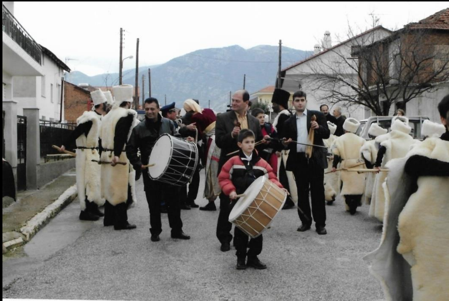
Οι Μωμόγεροι στους δρόμους του χωριού