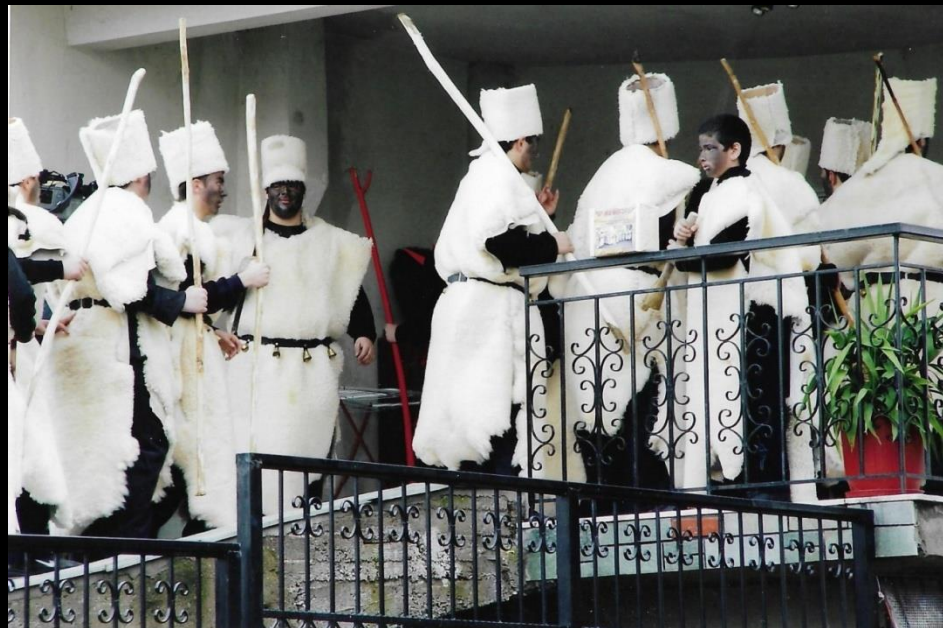
Επίσκεψη σε σπίτι του χωριού