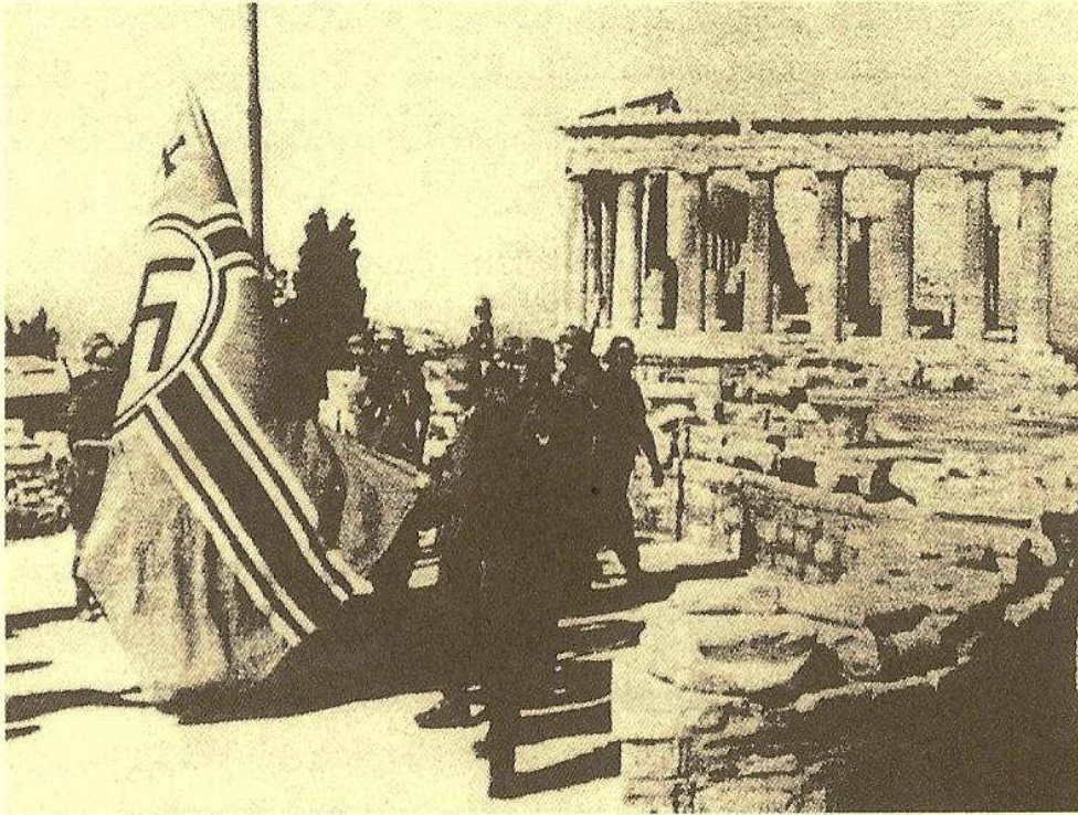
27 Απριλίου 1941, έπαρση της γερμανικής πολεμικής σημαίας στην Ακρόπολη

κι έτσι τα απορρίπταμε. Από τη στιγμή όμως εκείνη το βρήκαμε σωστό, και αρχίσαμε να μεθοδεύουμε το πώς και τι θα κάναμε.