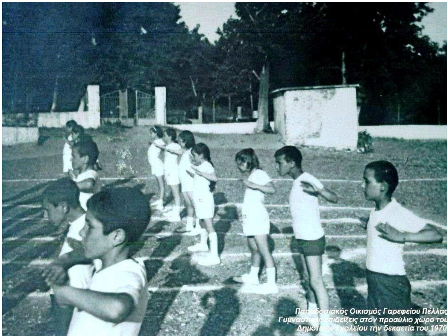
Παραδοσιακός Οικισμός Γαρεφείου Πέλλας Γυμναστικές επιδείξεις στον προαύλιο χώρο του Δημοτικού Σχολείου την δεκαετία του 1970.