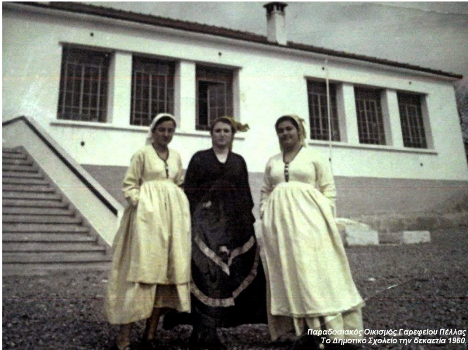
Παραδοσιακός Οικισμός Γαρεφείου Πέλλας Το Δημοτικό Σχολείο την δεκαετία 1960.