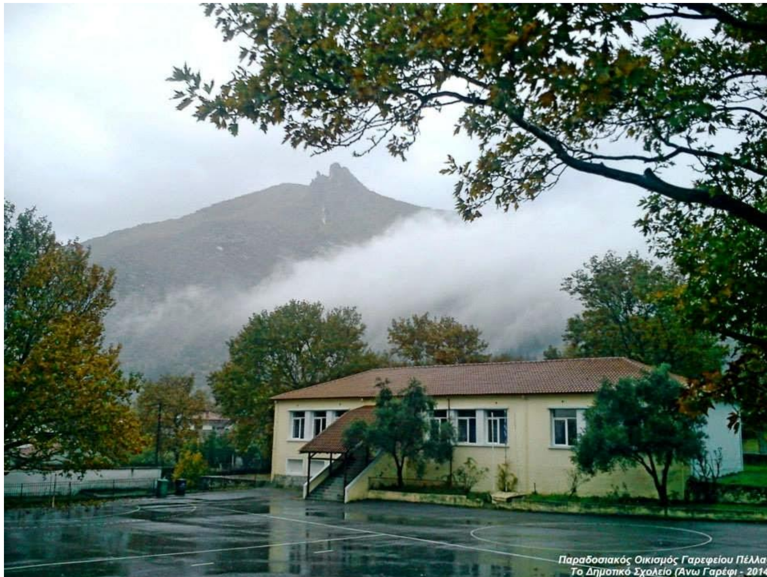
Παραδοσιακός Οικισμός Γαρφείου Πέλλας Το Δημοτικό Σχολείο (Ανω Γαρέφι - 2014)