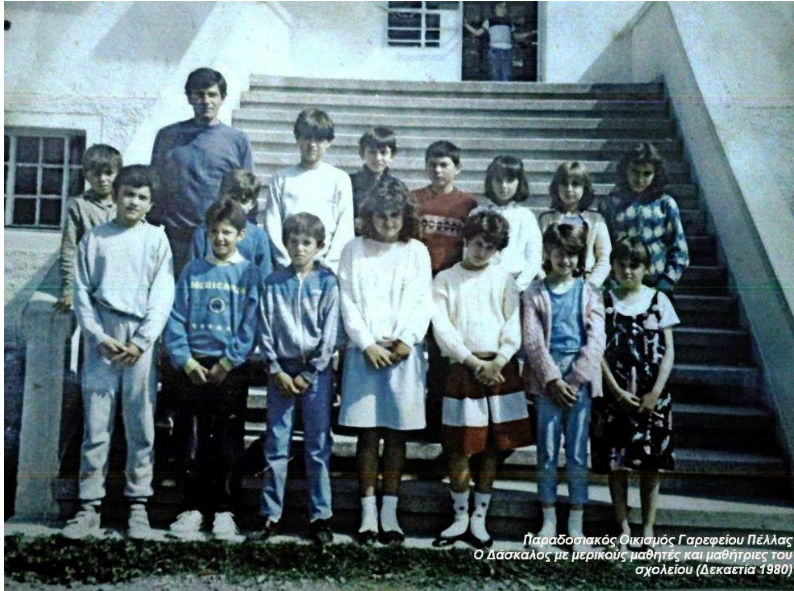
Παραδοσιακός Οικισμός Γαρεφίου Πέλλας Ο Δάσκαλος με μερικούς μαθητές και μαθήτριες του σχολείου (Δεκαετία 1980)