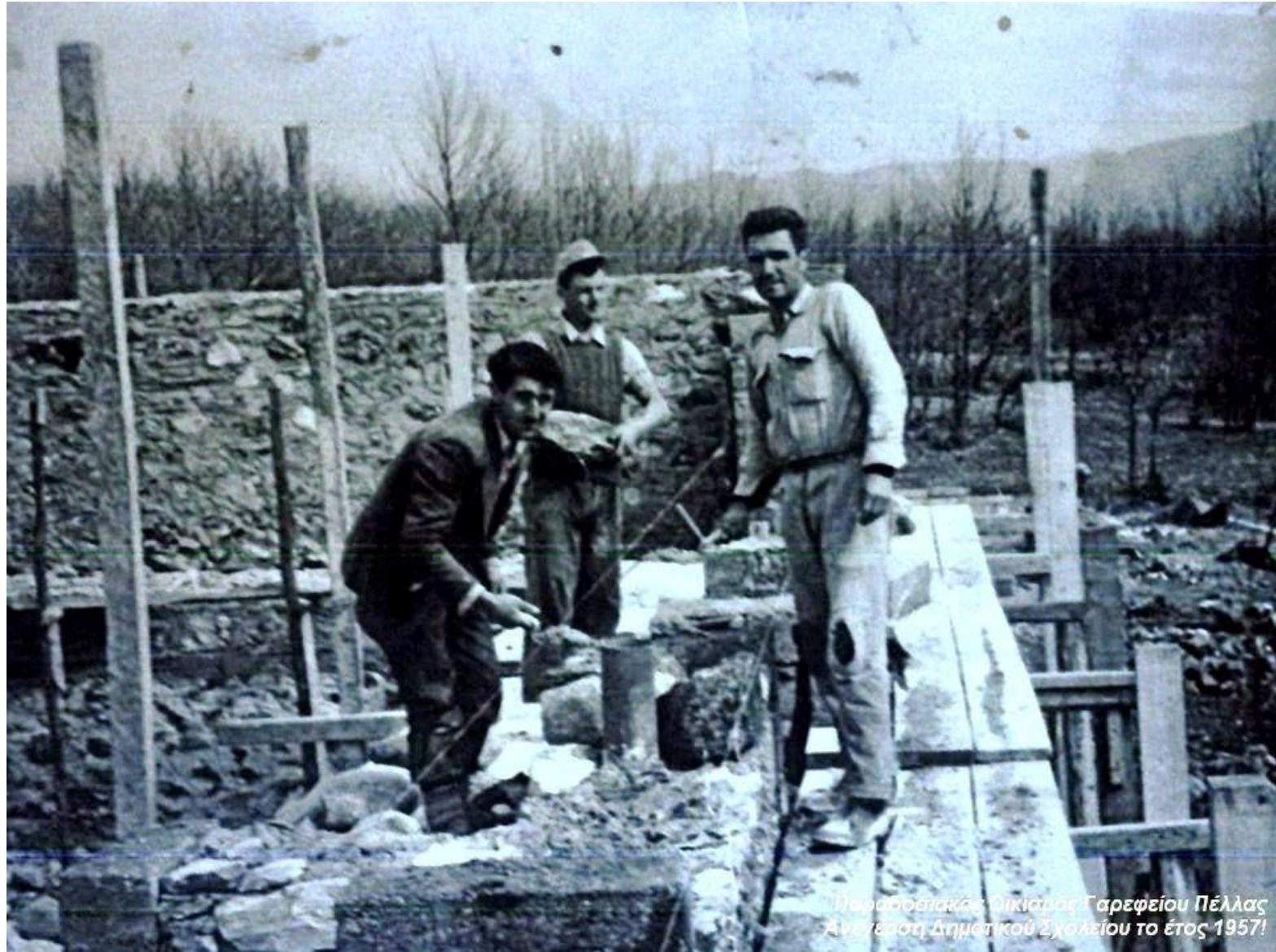
Παραδοσιακός Οικόσπρος Γαρεφείου Πέλλας Ανάγερση Δημητρίου Σχολαίου το έτος 1957!