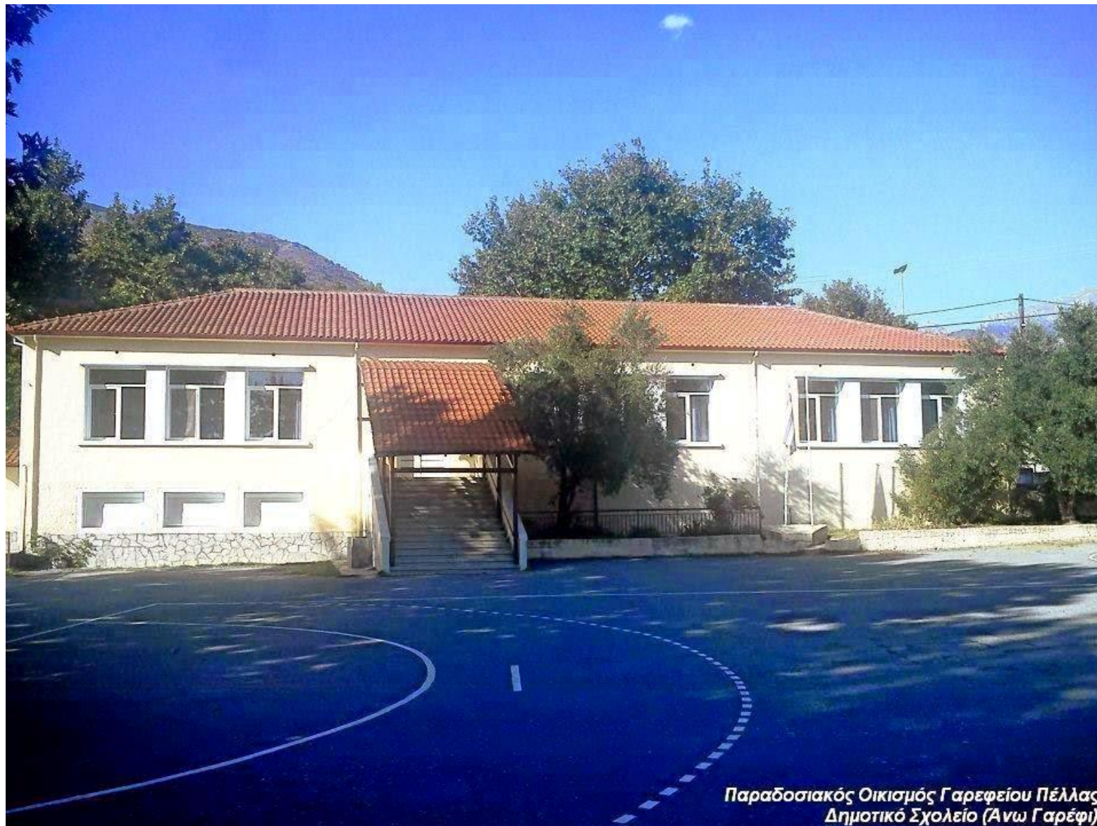
Παραδοσιακός Οικισμός Γαρεφείου Πέλλας Δημοτικό Σχολείο (Ανω Γαρέφι)