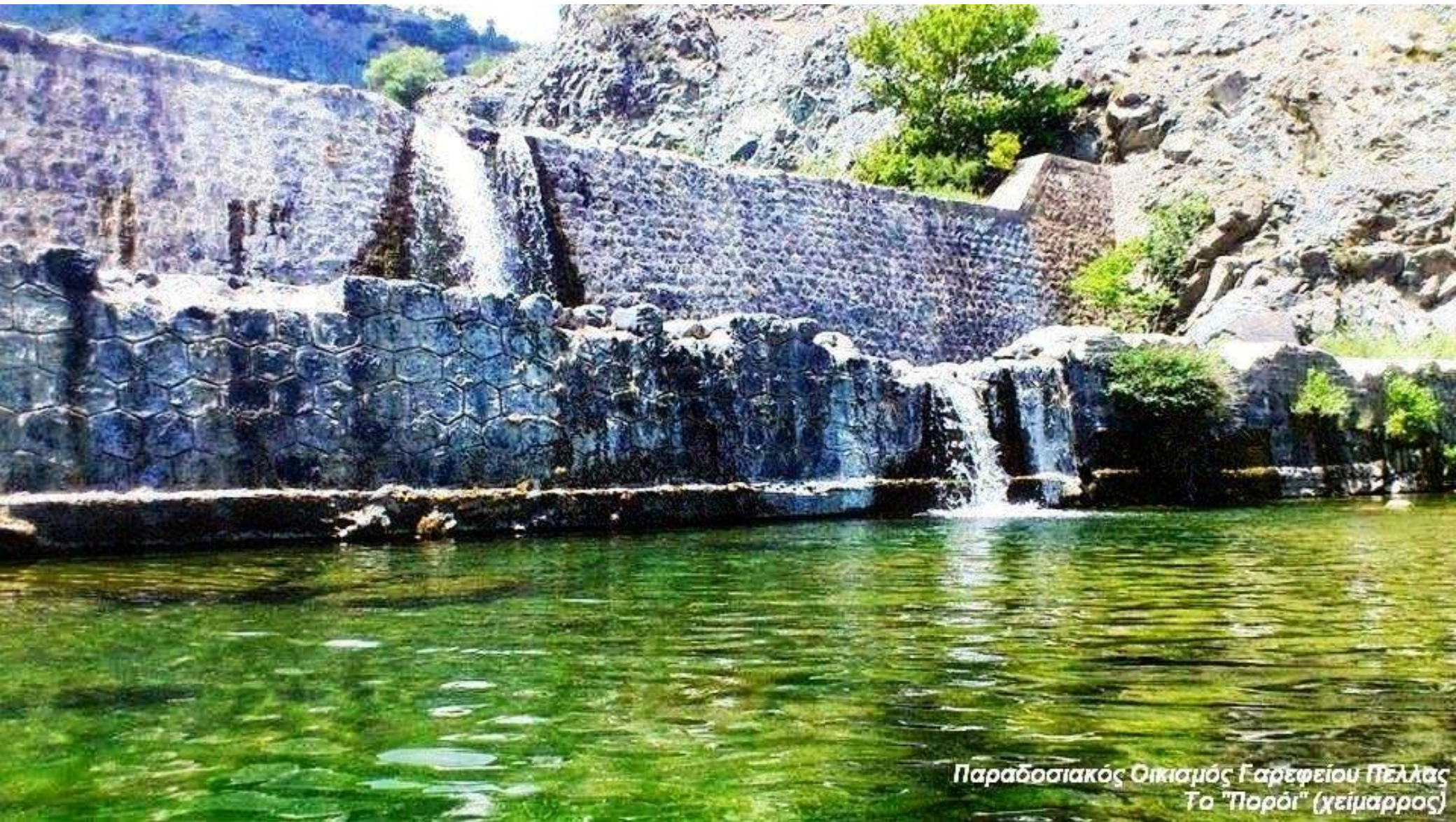
Παραδοσιακός Οικισμός Γαρεφείου Πέλλας Το "Ποροί" (χειμαρρός)