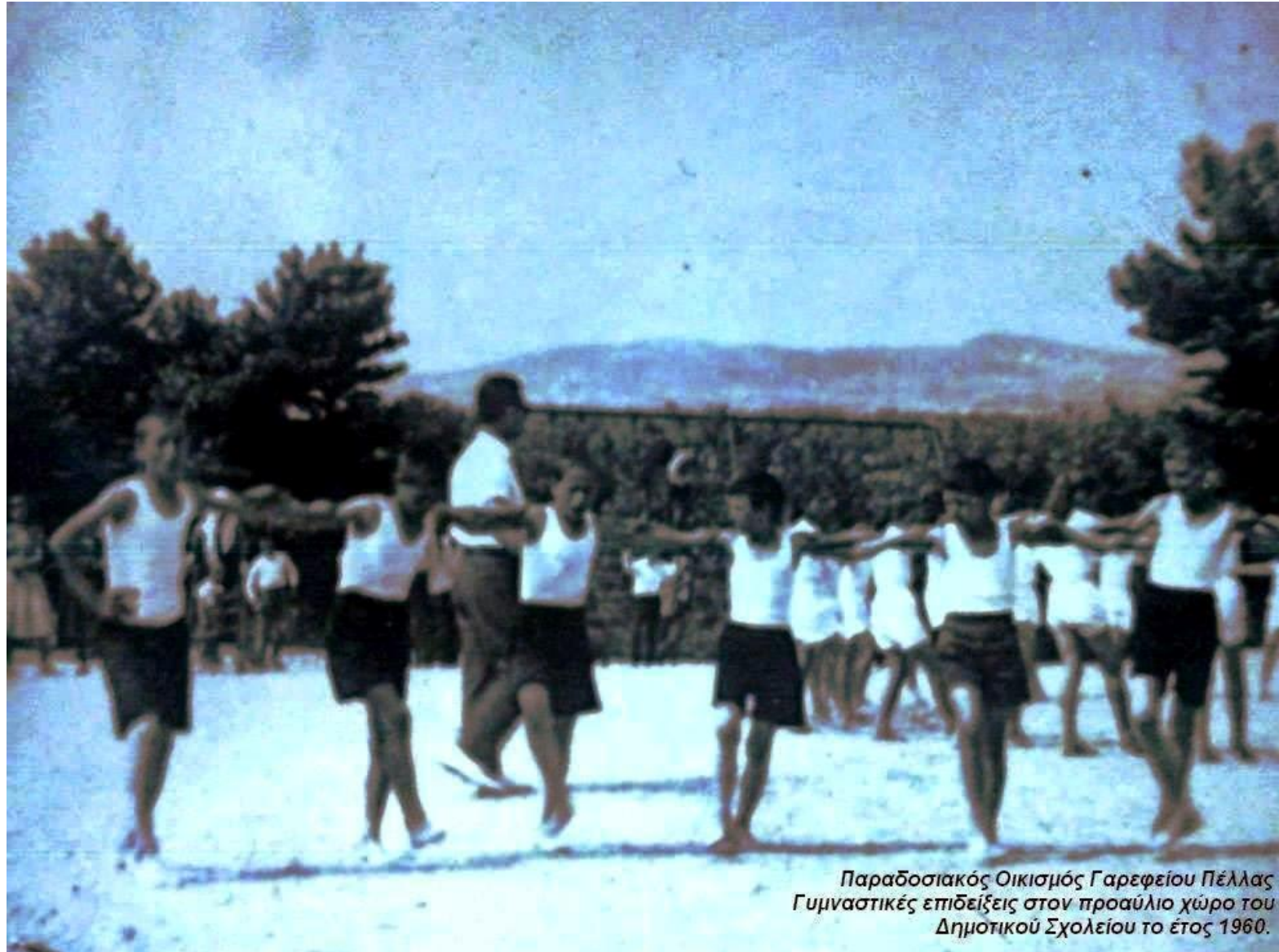
Παραδοσιακός Οικισμός Γαρεφείου Πέλλας Γυμναστικές επιδείξεις στον προαύλιο χώρο του Δημοτικού Σχολείου το έτος 1960.