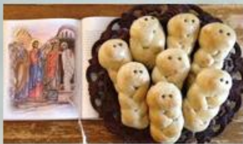
Φτιάχνουμε τα Λαζαράκια