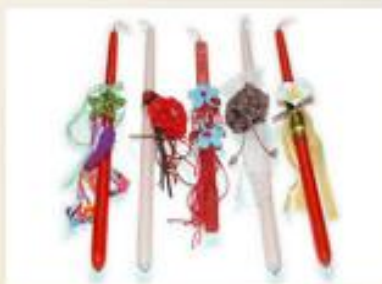
Πηγαίνουμε με τη λαμπάδα στην Ανάσταση