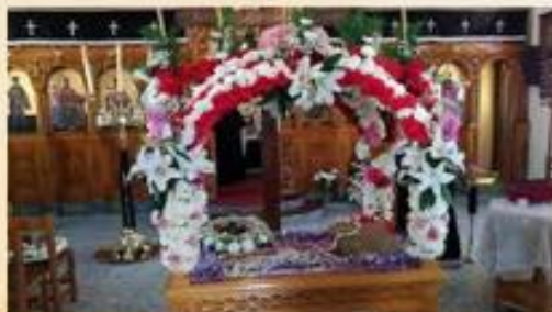
Πηγαίνουμε στον Επιτάφιο