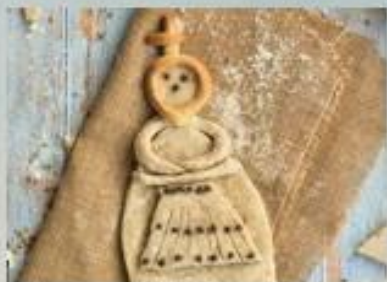
Φτιάχνουμε την κυρα Σαρακοστή