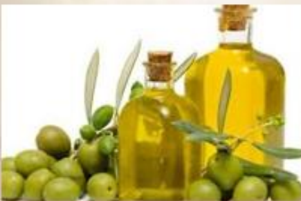
λάδι και ελιές