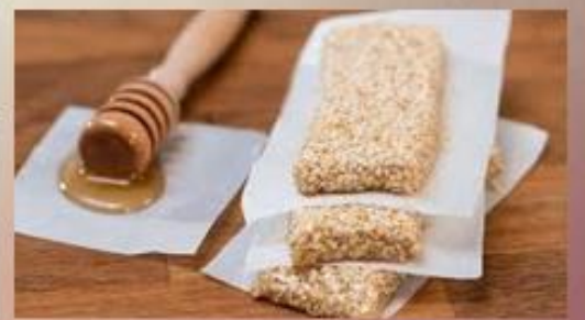
μέλι και παστέλι