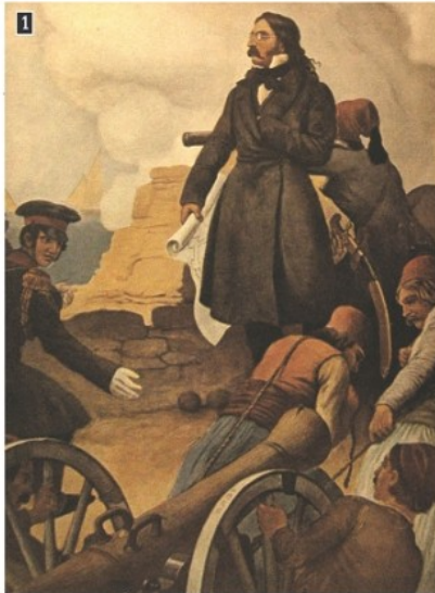
▲ Ο Αλέξανδρος Μαυροκορδάτος, λιθογραφία του Πέτερ φον Ες

Πήγαινε στην τέταρτη σελίδα του κεφαλαίου 16. Θα δεις την ακόλουθη εικόνα: