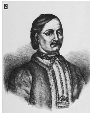
▲ Ο Ιωάννης Κωλέττης

Κάνοντας κλικ πάνω στα εικονίδια των μεγεθυντικών φακών θα διαβάσεις πληροφορίες για τη ζωή των δύο πολιτικών, του Αλέξανδρου Μαυροκορδάτου και του Ιωάννη Κωλέττη που έπαιξαν σημαντικό ρόλο στα πολιτικά γεγονότα της εποχής. Επίλεξε όποιο πρόσωπο επιθυμείς και γράψε στο τετράδιό σου μία σύντομη βιογραφία του (έως 120 λέξεις).