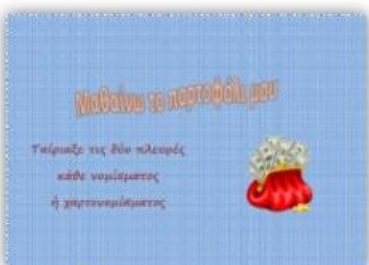
Μαθαίνω το πορτοφόλι μου

Ασκήσεις δεξιότητας σύνθεσης εικόνας, χωρισμένης σε δύο μέρη (αριστερό-δεξί). Εικόνες με άξονα συμμετρίας, αλλά και χωρίς.