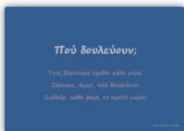
Επαγγέλματα και τόπος εργασίας