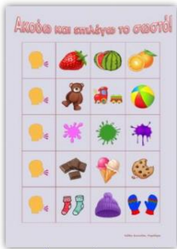
Ακούω και επιλέγω το σωστό