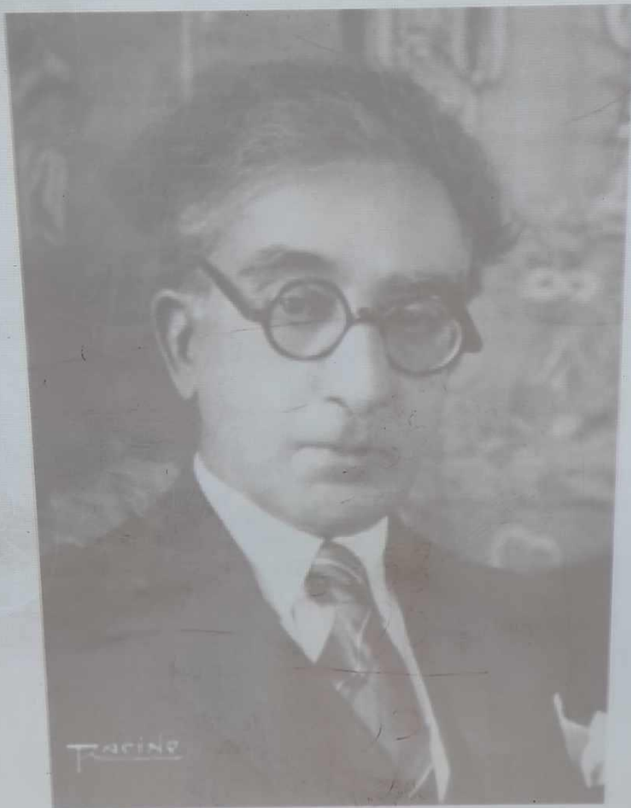
Ο Κωνσταντίνος Καβάφης (αχρονολόγητη φωτογραφία)