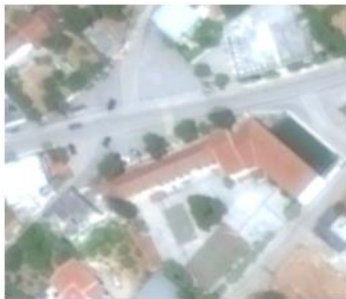
Πρώτος χώρος καταφυγής