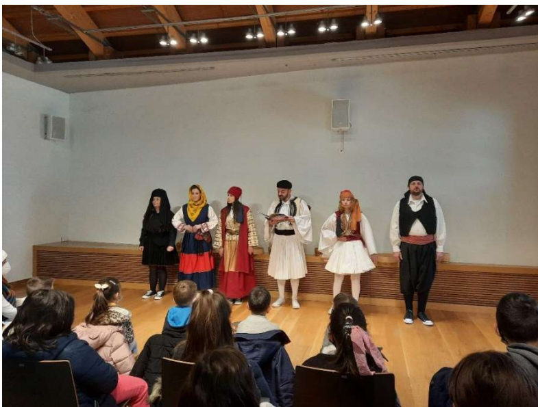
ΑΠΟ ΤΗΝ ΘΕΑΤΡΙΚΗ ΠΑΡΑΣΤΑΣΗ «ΜΠΑΡΟΥΤΙ ΓΙΑ ΤΗΝ ΕΠΑΝΑΣΤΑΣΗ»

Η παράσταση πραγματοποιήθηκε από μέλη της Θεατρικής Ομάδας Ομίλου Πειραιώς, σε σκηνοθετική επιμέλεια Ζωής Ξανθοπούλου, με ταυτόχρονη διερμηνεία στην ελληνική νοηματική γλώσσα από την Ανδρονίκη Ξανθοπούλου.