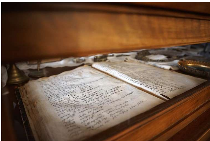
ΒΙΒΛΙΑ ΤΗΣ ΕΠΑΝΑΣΤΑΣΗΣ

Η βιβλιοθήκη της Δημητσάνας είναι σημαντικός σταθμός πολιτισμού στη Γορτυνία. Επίσημος τίτλος της τριμερούς δημόσιας υπηρεσίας είναι «Δημόσια βιβλιοθήκη και Μουσείο Ελληνικής Σχολής Δημητσάνας – Τοπικό Ιστορικό αρχείο Γορτυνίας». Ιδρύθηκε από μοναχούς, τους Γεράσιμο Γούνα και Αγάπιο Λεονάρδο, από τη σχολή Σμύρνης το 1764 και λειτούργησε πρώτα ως ιερατική σχολή, στην οποία κατά τα χρόνια της Τουρκοκρατίας φοίτησαν πολλοί ιεράρχες του Γένους, εξέχουσες προσωπικότητες, όπως ο Οικουμενικός Πατριάρχης Γρηγόριος Ε΄ και ο Παλαιών Πατρών Γερμανός, καθώς και ο Παπαφλέσσας.