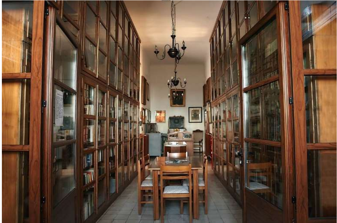
ΕΣΩΤΕΡΙΚΟ ΤΗΣ ΒΙΒΛΙΟΘΗΚΗΣ

Μη λησμονούμε ότι το μεγαλύτερο μέρος του πλούσιου υλικού που φιλοξενούσε η βιβλιοθήκη θυσιάστηκε στον βωμό της Ελληνικής Επανάστασης του 1821, όταν οι σελίδες των βιβλίων χρησιμοποιήθηκαν για να κατασκευαστούν φυσίγγια.