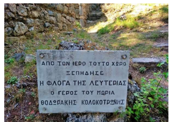
ΜΝΗΜΙΟ ΣΤΟΝ ΕΞΩΤΕΡΙΚΟ ΧΩΡΟ ΤΗΣ ΟΙΚΙΑΣ ΤΟΥ ΓΕΡΟΥ ΤΟΥ ΜΟΡΙΑ

Τέλος στην Τρίπολη, τη γνωστή Τριπολιτσά, το κέντρο της Πελοποννήσου, παίρνονταν σπουδαίες αποφάσεις για την επανάσταση του '21.