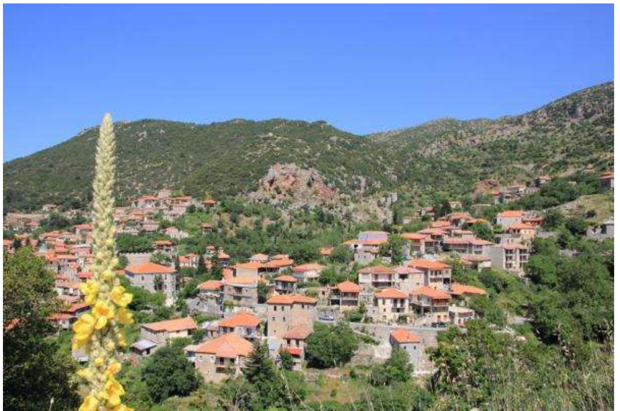
ΠΑΝΟΡΑΜΙΚΗ ΘΕΑ ΤΗΣ ΣΤΕΜΝΙΤΣΑΣ

Στη Δημητσάνα λίγα χιλιόμετρα μακριά από τη Στεμνίτσα καταγόταν ο Παλαιών Πατρών Γερμανός. Στη Δημητσάνα επίσης ήταν οι μπαρουτόμυλοι που σήμερα είναι μουσείο.