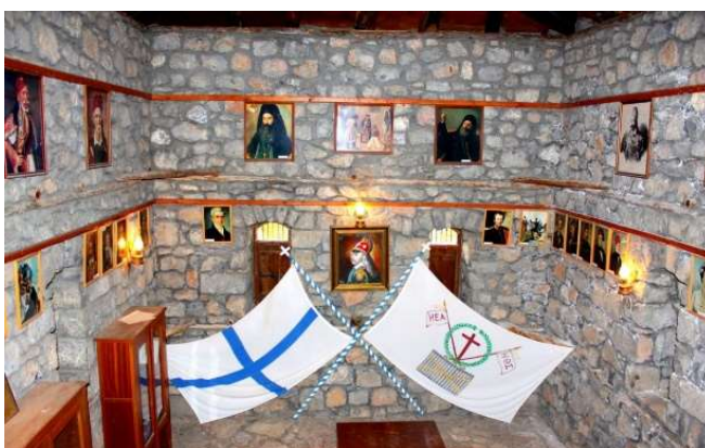
ΤΟ ΣΠΙΤΙ ΤΟΥ ΚΟΛΟΚΟΤΡΩΝΗ ΣΤΟ ΛΙΜΠΟΒΙΣΙ

Το χωριό Λιμποβίσι, μερικά χιλιόμετρα νότια της Βυτίνας, θεωρείται ο τόπος όπου έζησε τα παιδικά του χρόνια ο Θεόδωρος Κολοκοτρώνης. Το κτίσμα, όπου σύμφωνα με την παράδοση, γεννήθηκε ο «Γέρος του Μοριά», σκαρφαλωμένο σε ένα μικρό ύψωμα, έχει ανασκευαστεί και λειτουργεί σαν μουσείο.