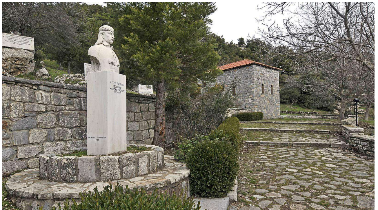
ΠΡΟΤΟΜΗ ΤΟΥ ΘΕΟΔΩΡΟΥ ΚΟΛΟΚΟΤΡΩΝΗ ΣΤΟΝ ΠΡΟΑΥΛΙΟ ΧΩΡΟ ΤΗΣ ΟΙΚΙΑΣ ΤΟΥ

Ο Κολοκοτρώνης γράφει στα Απομνημονεύματά του: «Επήραμε τη βιβλιοθήκη της Δημητσάνας και δέναμε φυσέκια. Μπαρούτη είχαμε, έκαμνε η Δημητσάνα. Του μπαρουτιού την υπόθεση είχαν πάρει επάνω τους τα αδέρφια Σπηλιωτόπουλοι και δια να δουλεύσουν τη μπαρούτη δεν επαίρναμε πολλούς Δημητσανίτες στο στρατόπεδο, τους αφήναμε δια αυτήν την δούλευσιν».