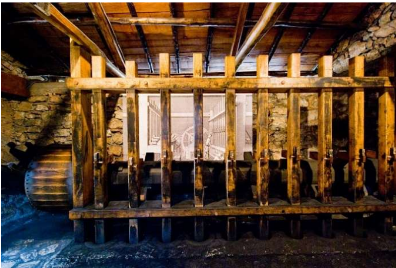
ΜΠΑΡΟΥΤΟΜΥΛΟΙ ΣΤΟ ΥΠΑΙΘΡΙΟ ΜΟΥΣΕΙΟ ΥΔΡΟΚΙΝΗΣΗΣ

Στην αρχή δεν υπήρχαν μπαρουτόμυλοι, έφτιαχναν τη μπαρούτη στα σπίτια τους, ανακατεύοντας με γουδιά για πολλές ώρες τα υλικά (75% νίτρο, 15% κάρβουνο, 10% θειάφι). Αργότερα στις αρχές του 19ου αιώνα κατασκευάστηκαν οι υδροκίνητοι μπαρουτόμυλοι στο Κεφαλάρι του Αγίου Ιωάννη.