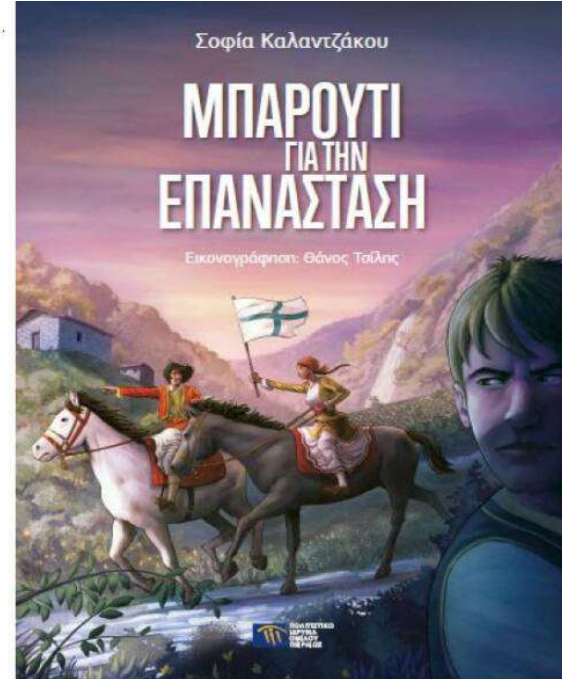
ΒΙΒΛΙΟ «ΜΠΑΡΟΥΤΙ ΓΙΑ ΤΗΝ ΕΠΑΝΑΣΤΑΣΗ»

Το βιβλίο, που εκδόθηκε στο πλαίσιο των Επετειακών Δράσεων της Τράπεζας Πειραιώς για τα 200 χρόνια από την Επανάσταση του 1821, έχει αφηγηρία τον ιστορικό ρόλο της Δημητσάνας κατά τα προεπαναστατικά χρόνια και κατά την Επανάσταση του '21, ενώ παράλληλα αναδεικνύει τη σημασία της υδροκίνησης για τη λειτουργία μπαρουτόμυλων και την παραγωγή μπαρουτιού.