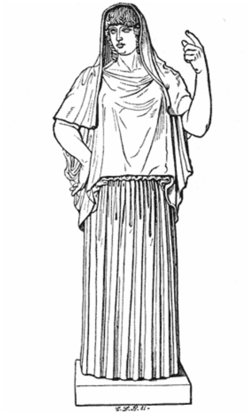
THE GIUSTINIANI HESTIA. (Rome, now in the Torlonia Museum .) [In the original the left hand is nearer the shoulder; the forefinger modern.]

Η Εστία ήταν η θεά του σπιτιού. Προστάτευε τα νοικοκυριά, γι' αυτό σ' όλα τα σπίτια υπήρχε ένας μικρός βωμός δικός της, η εστία.