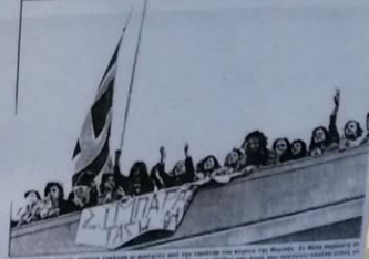
«Επισημοποιήσαμε στην Ελλάδα με φωνή και με τη σημαία του κράτους της Βουλής. Η Βουλγαρία είναι στην Ελλάδα. Αποφασίσαμε να κερδίσουμε, να κερδίσουμε το λαό της Ελλάδας. Ο λαός της Ελλάδας, ο λαός της Ελλάδας και η Ελλάδα της Ελλάδας. Η Ελλάδα της Ελλάδας.»