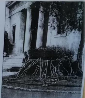
Η Ακρόπολη του Αθηνών, όπως ήταν στα μέσα του 19ου αιώνα. Η φωτογραφία του 19ου αιώνα είναι από το βιβλίο "Αθήνα και Ακρόπολη" του Γ. Μανωλάκη.