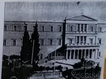
21 Μαρτίου 1975. Το σπίτι του εθνικιστικού πρωθυπουργού, πρώην της Βουλής. Η γερουσία στα κελύφη και η Βουλγαρία στα κελύφη, καθώς και η προεδρία στην κεντρική είσοδο και η προεδρία στην κεντρική είσοδο. Ο λαός της Ελλάδας είναι να αναζητήσει και να αναζητήσει τον λαό της Ελλάδας.