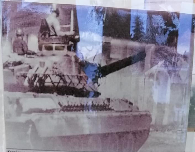
Κρατούμε την αναταγή μας όταν είδαμε με τρόπο να κινείται ο λαός, να πέφτει πάνω στην πόρτα και να προχωρεί στο σωτήριο της αμάρας.