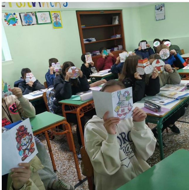
Οι χριστουγεννιάτικες κάρτες που παραλάβαμε.