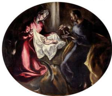
Η γέννηση του Ιησού Δομήνικος Θεοτοκόπουλος