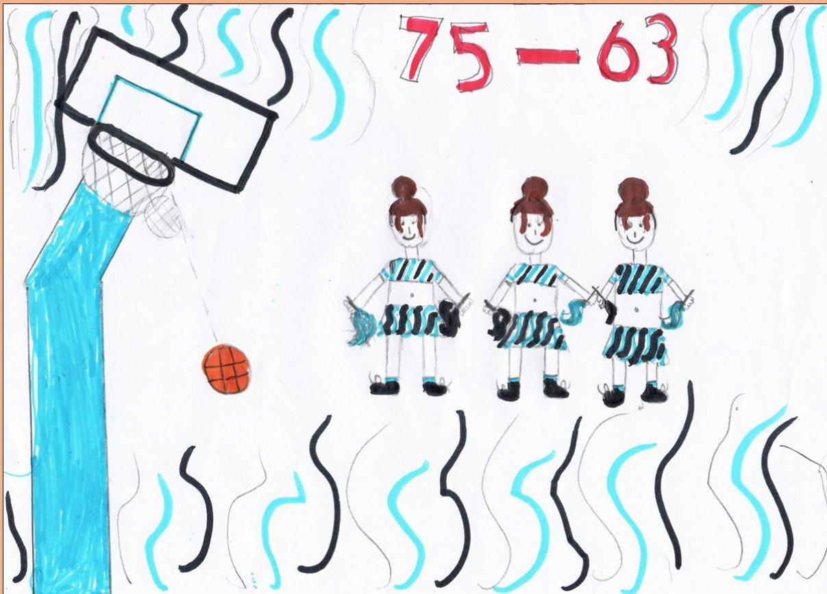
Εικόνα: Χαριτίνη Ταχλιαμπούρη, Δ' 2

Κόουτς: Αυτό έχει να κάνει με το αν θα παίξουν οι Αντετοκούνμπο ή όχι. Πολλές φορές η ομάδα εμφανίζεται καλή. Πάντα είναι καλή, πάντα πρωταγωνιστεί αλλά, αν έρθει ο Γιάννης, θα είμαστε πολύ καλοί.