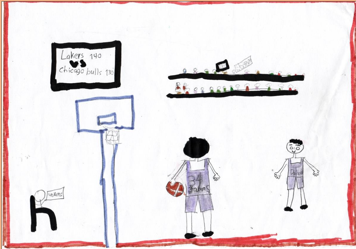
Εικόνα: Τζένη Παραπονιάρη, Δ΄ 2

Παιδιά: Ποια ήταν η πρώτη ομάδα που προπονήσατε;