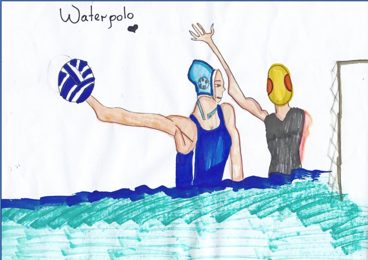
Εικόνα: Μαρία Τσιάγκρα, Στ' 2

Παιδιά: Ποιο είναι πιο ενδιαφέρον για εσάς; Να είστε προπονητής ή παίκτης;