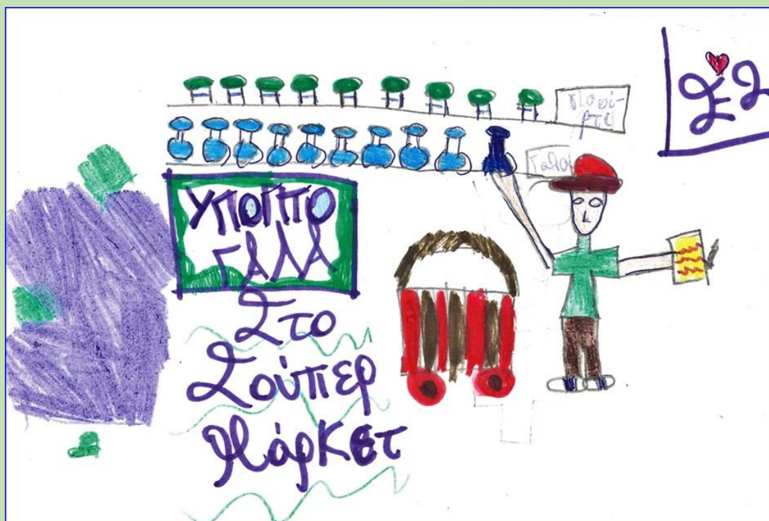
Εικόνα: Μυριάνθη Παραπονιάρη, Ε' 2