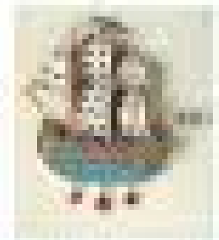
Στατιστική ανάλυση αποτελεσμάτων έρευνας [199]

Παρατηρήστε τις απαντήσεις, διαβάστε τις ερωτήσεις και πάλι