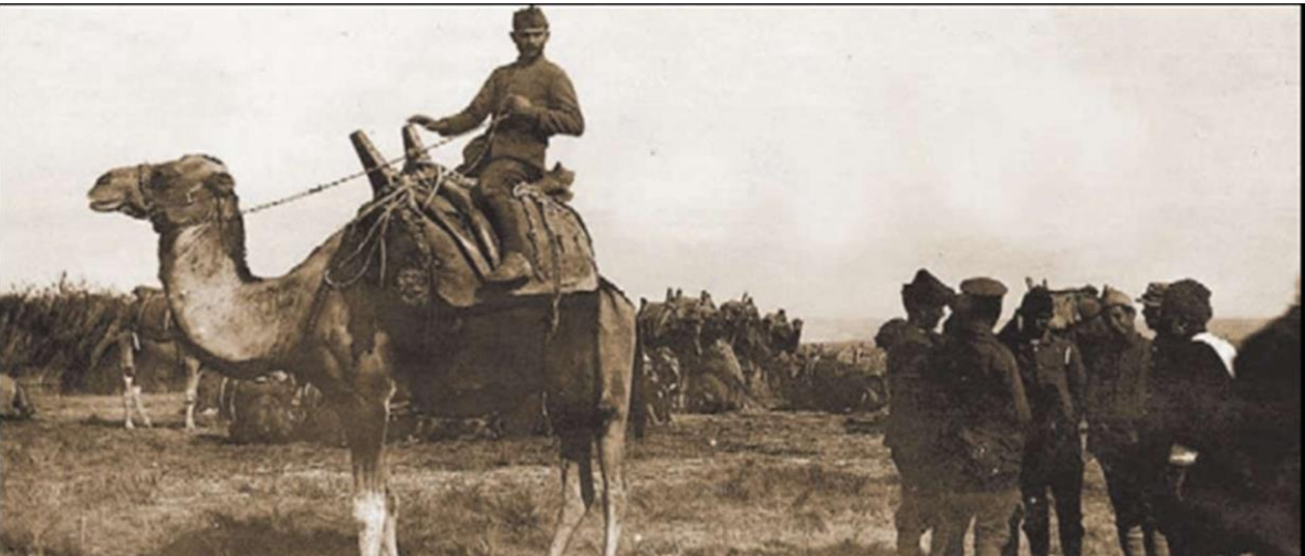
(Εφοδιοπομπή από καμήλες κοντά στο Σαγγάριο.)

Υπήρξαν όμως προβλήματα εφοδιασμού του στρατού μας και εχθρική στάση των Συμμάχων που ήταν υπέρ των Τούρκων.