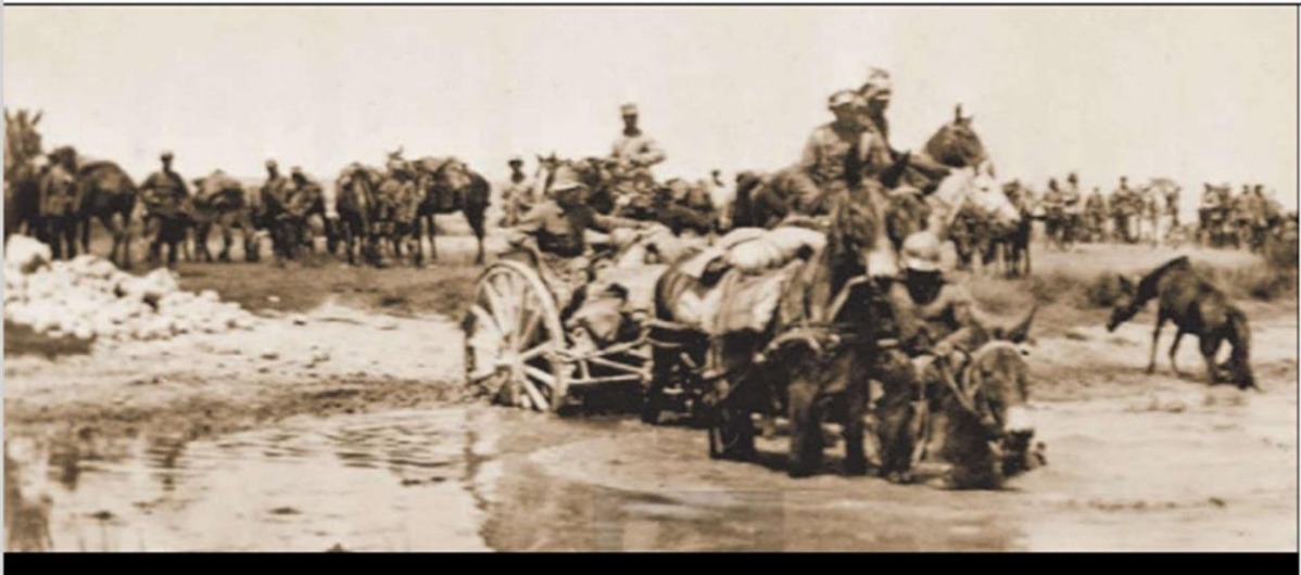
( Διάβαση του ποταμού Σαγγάριου.)

Υπήρξαν όμως προβλήματα εφοδιασμού του στρατού μας και εχθρική στάση των Συμμάχων που ήταν υπέρ των Τούρκων.