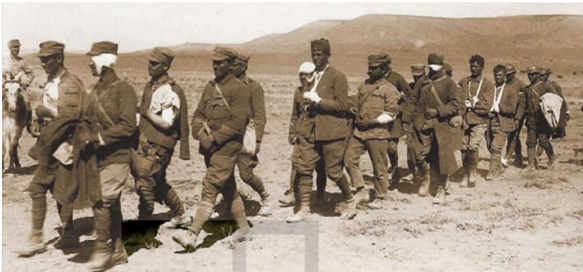
(Αναχώρηση των τραυματιών της μάχης)

Τον Αύγουστο (1922) έγινε αιφνιδιαστικά τουρκική αντεπίθεση και το ελληνικό μέτωπο κατέρρευσε. Έτσι, άρχισε η υποχώρηση του ελληνικού στρατού προς τα παράλια. Τις δραματικές εκείνες ώρες ο Νικ. Πλαστήρας κατόρθωσε να διασώσει μερικά στρατιωτικά τμήματα και αμέτρητο πλήθος αμάχων Ελλήνων που έφευγαν πανικόβλητοι, για να αποφύγουν τις σφαγές των Τούρκων.