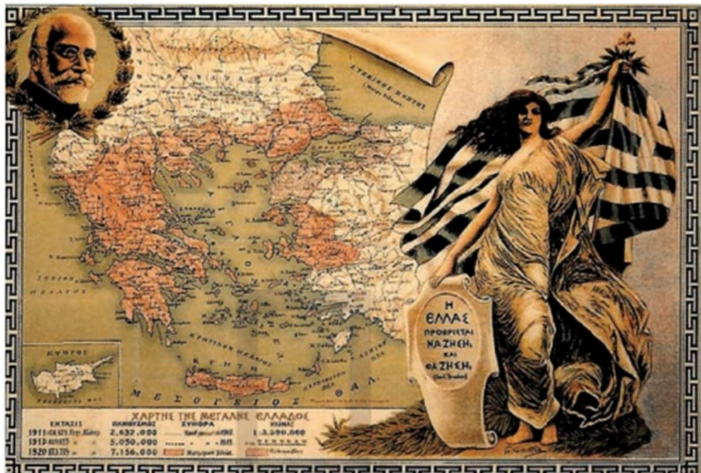
Λιθογραφία της εποχής που απεικονίζει την Ελλάδα «των πέντε θαλασσών και των δύο ηπείρων».

Στις εκλογές του Νοεμβρίου 1920 ο Βενιζέλος ηττήθηκε και η κυβέρνηση του Γούναρη που σχηματίστηκε με δημοψήφισμα επαναφέρει τον έκπτωτο βασιλιά Κωνσταντίνο. Οι Σύμμαχοι όμως ήταν εναντίον του Κωνσταντίνου, επειδή ήταν φίλος των Γερμανών και άλλαξαν στάση απέναντι της Ελλάδας υποστηρίζοντας το κίνημα Κεμάλ. Το Μάρτη (1921) η ελληνική κυβέρνηση αποφασίζει την προέλαση στρατού στο εσωτερικό της Μ. Ασίας και μετά από σκληρές μάχες φτάνει στο Σαγγάριο ποταμό, κοντά στην Άγκυρα.