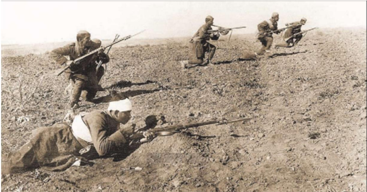
(Οι Έλληνες προωθούνται ενάντια των Τούρκων.)

Τον Αύγουστο (1922) έγινε αιφνιδιαστικά τουρκική αντεπίθεση και το ελληνικό μέτωπο κατέρρευσε. Έτσι, άρχισε η υποχώρηση του ελληνικού στρατού προς τα παράλια. Τις δραματικές εκείνες ώρες ο Νικ. Πλαστήρας κατόρθωσε να διασώσει μερικά στρατιωτικά τμήματα και αμέτρητο πλήθος αμάχων Ελλήνων που έφευγαν πανικόβλητοι, για να αποφύγουν τις σφαγές των Τούρκων.