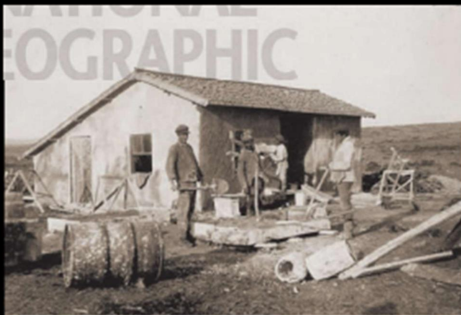
NATIONAL GEOGRAPHIC NOVEMBER 1918

Η ανάκαμψη της Τουρκίας μετά την ήττα της στον Α΄ παγκόσμιο πόλεμο και ο επακόλουθος θρίαμβός της επί των Ελλήνων στη μικρά Ασία ήταν οι αιτίες αυτής της μεγάλης μετακίνησης, που τελικά πήρε τη μορφή ενός « διακανονισμού ανταλλαγής» φυλετικών μειονοτήτων -σύμφωνα με ειδικούς όρους- που τελούσε υπό την υψηλή επίβλεψη της Κοινωνίας των Εθνών.