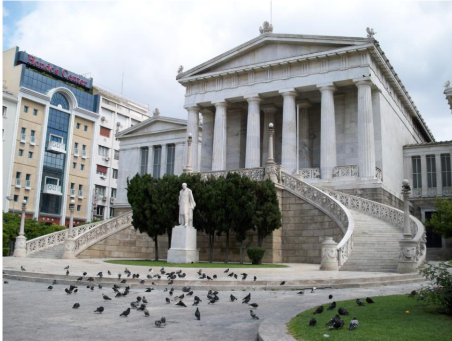
Εθνική Βιβλιοθήκη, Αθήνα