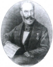
Ν. Χ. Μάντζαρος N. Ch. Manzaros 1795-1872