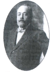
Σπ. Φ. Σαμάρας Sp. F. Samaras 1861-1917

mail@gym-mous-kerkyr.ker.sch.gr http://gym-mous-kerkyr.ker.sch.gr