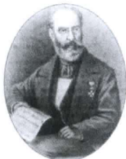
N. X. Μάντζαρος N. Ch. Manzaros 1795-1872