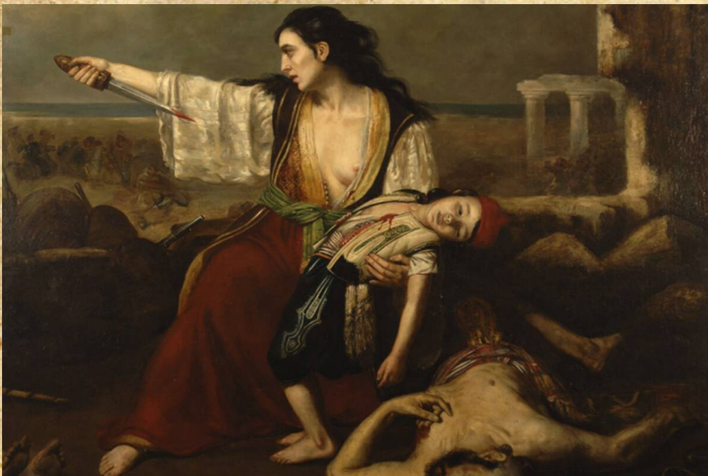
François-Émile de Lansac. Η αυτοθυσία της μάνας (1827).