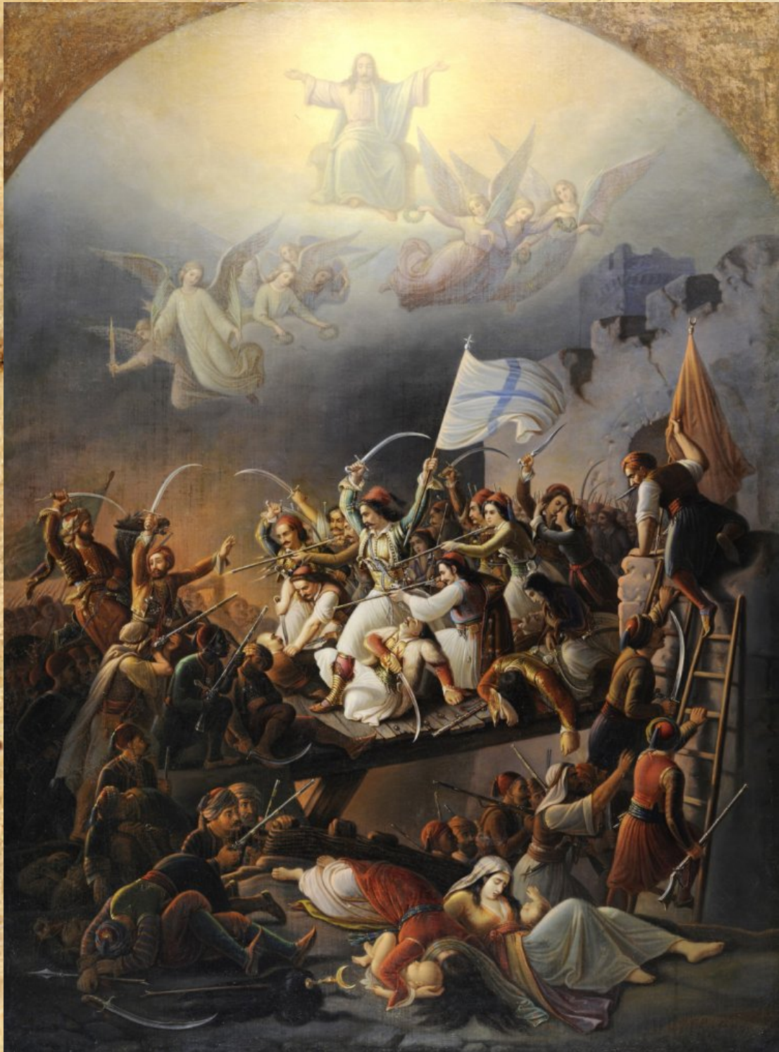
Θ. Βρυζάκης, Η έξοδος του Μεσολογγίου , 1853