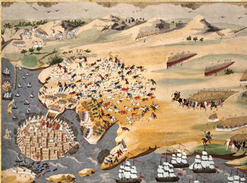
Π. Ζωγράφος, Η πολιορκία του Μεσολογγίου