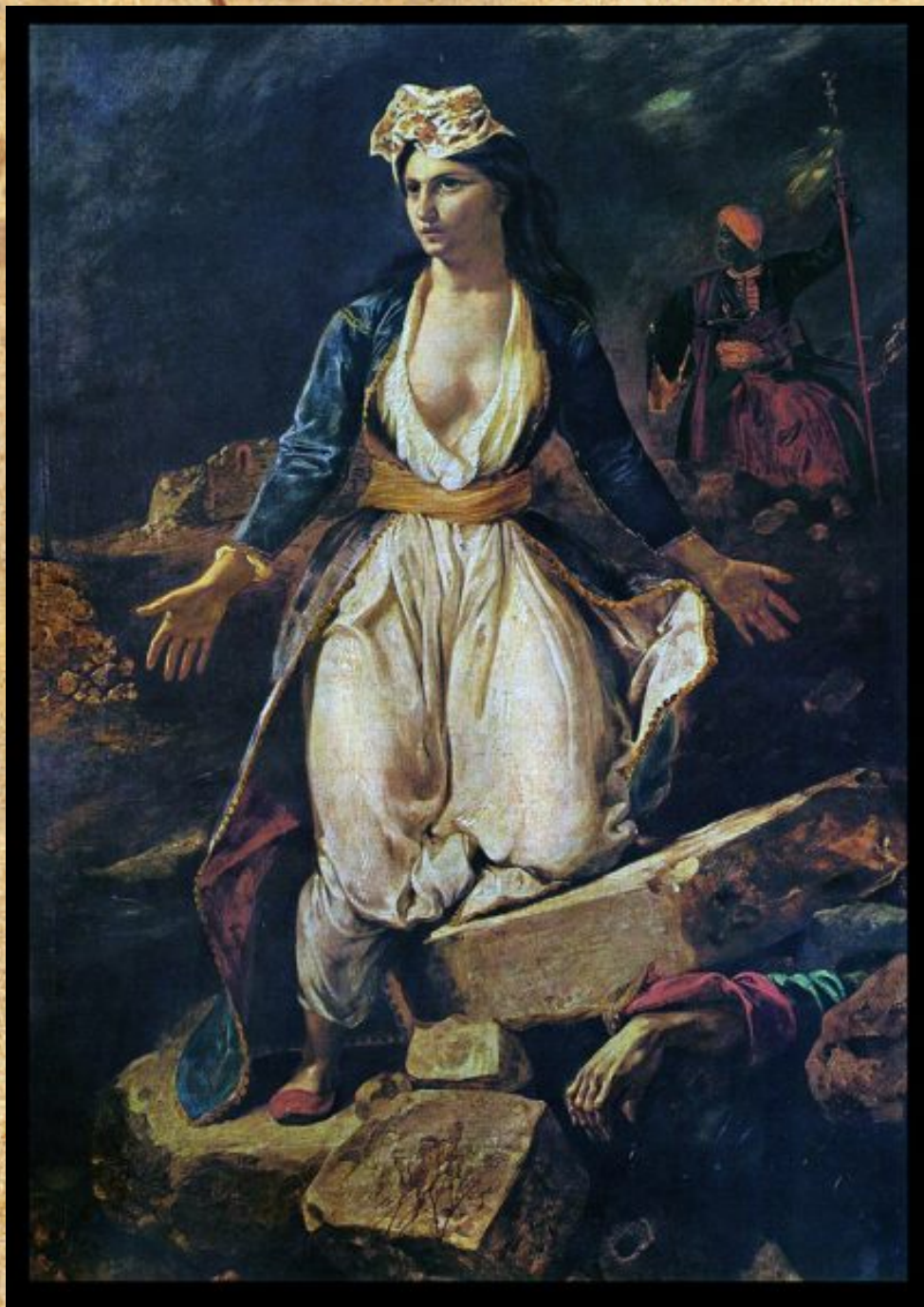
Ε. Ντελακρουά, Η Ελλάδα στα ερείπια του Μεσολογγίου, 1826