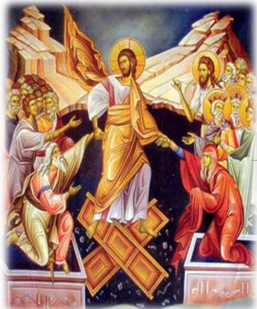
Η Ανάσταση του Χριστού