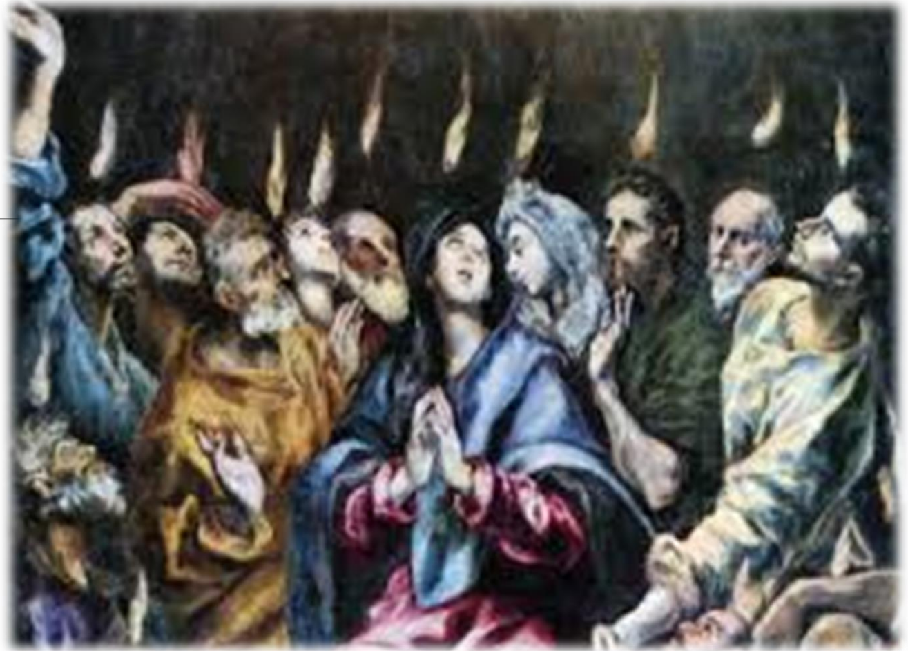
Πεντηκοστή El Greco