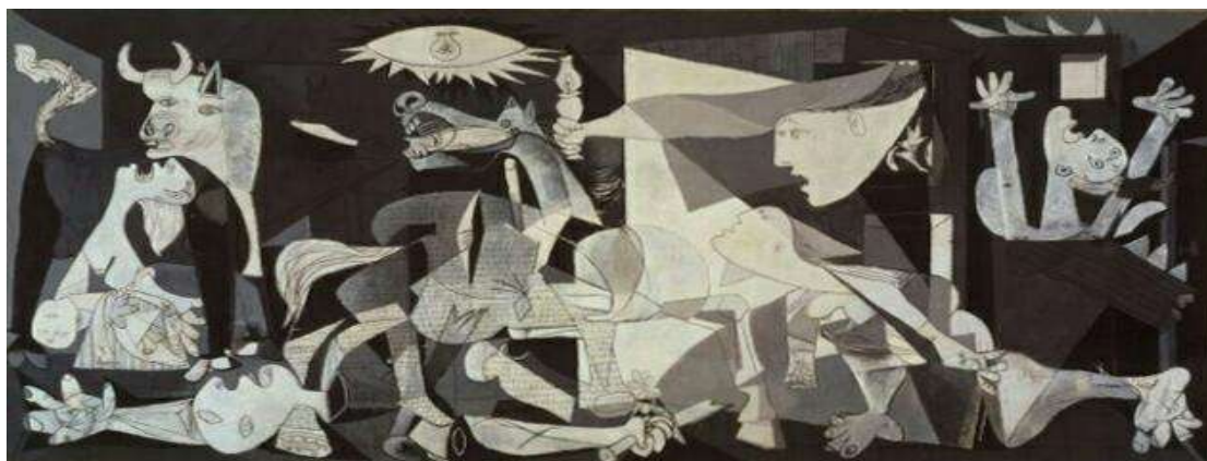
Γκερνίκα , Πικάσο,1937

Τα νήπια της 1 ης ομάδας , παρατηρούν το πίνακα , βλέπουν ένα το βίντεο και μαθαίνουν πληροφορίες για το πώς ο Πικάσο ζωγράφισε τον πίνακα τη συγκεκριμένη χρονική στιγμή , έπειτα εντοπίζουν στον πίνακα το άλογο και το απομονώνουν .