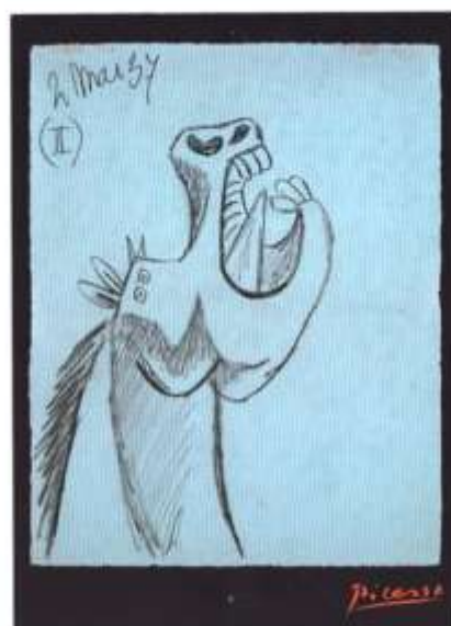
Το άλογο της Γκερνίκα , Πικάσο