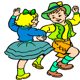
ΜΠΑΙΝΕΙ ΣΤΟ ΧΟΡΟ.