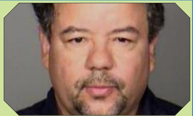
θεί μέχρι στιγμής κατηγορίες, αν και αρκακά είχαν συλληφθεί.

Σ το δικαστήριο αναμένεται να προσαχθεί ο 52χρονος, πρώην οδηγός σχολικού λεωφορείου, Άριελ Κάστρο, ο ιδιοκτήτης και κύριος ύποπτος στην υπόθεση αιχμαλωσίας τριών γυναικών για περίπου μία δεκαετία, στο Κλίβελαντ του Οχάιο. Την ίδια ώρα στο φως βγαίνουν νέες λεπτομέρειες σχετικά με τις απάνθρωπες συνθήκες κράτησης των τριών γυναικών και της 6χρονης Τζοελίν. Στον 52χρονο Άριελ Κάστρο έχουν απαγγελθεί τέσσερις κατηγορίες για απαγωγή και τρεις για βιασμό. Στους δύο αδελφούς του Κάστρο, Πέδρο 54 και Ονίλ 50 ετών, δεν έχουν απαγγελ-