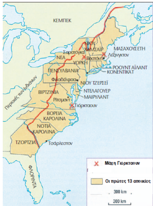
1. Οι 13 αγγλικές αποικίες στην Αμερική και η αμερικανική επανάσταση.

1607-1732: 13 αμερικανικές αποικίες υπό αγγλικό έλεγχο