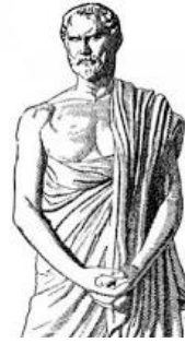
Εφιάλτης ο Αθηναίος