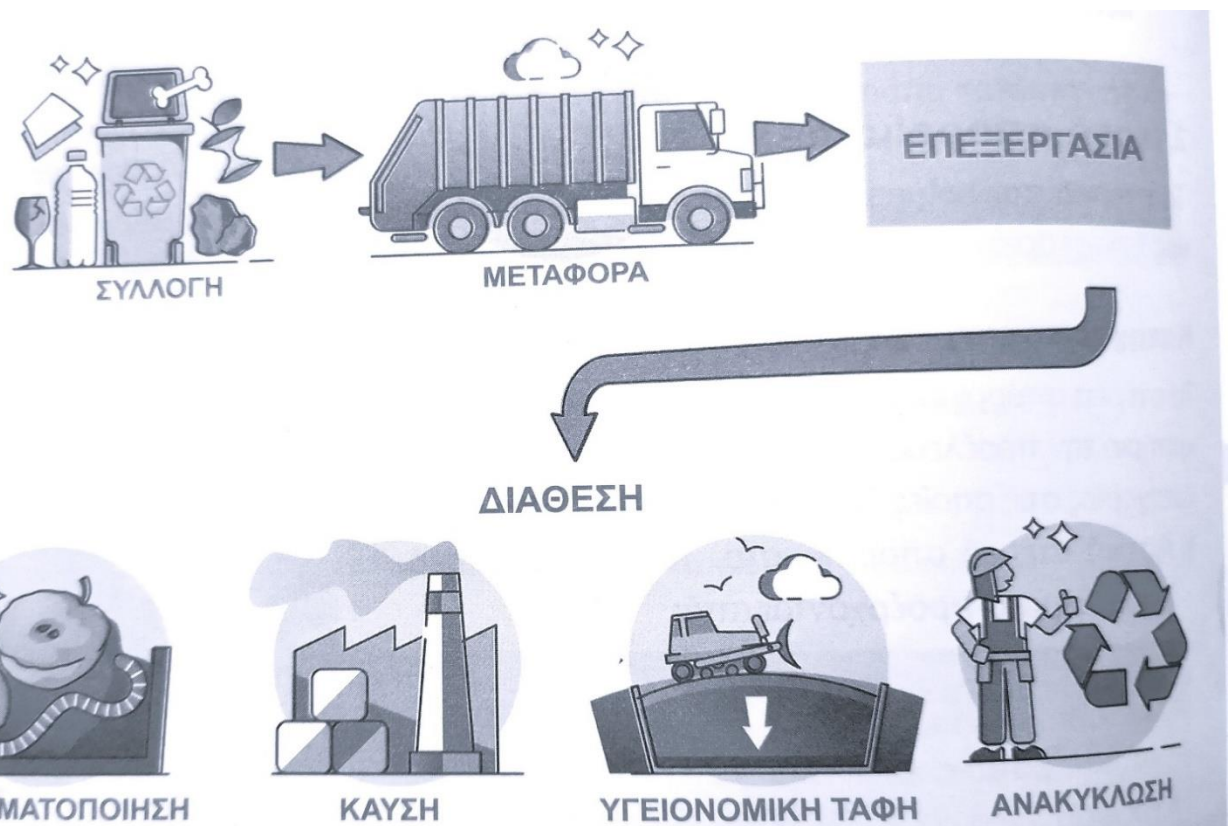
Εικόνα 25: Διαχείριση στερεών απορριμμάτων, συνοπτικά