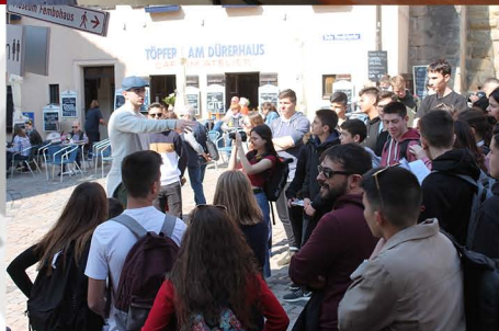
Πάνω δεξιά: Deutsches Museum Κάτω: Νυρεμβέργη, έξω από το σπίτι του Ντύρερ

Την Κυριακή αφού πήραμε πρωινό στο ξενοδοχείο αναχωρήσαμε για τη Νυρεμβέργη. Φτάσαμε με το πούλμαν στις 11:30 στη Νυρεμβέργη, ιδιαίτερη πατρίδα του ζωγράφου της Αναγέννησης Άλμπρεχτ Ντύρερ. Κατά την περιήγησή μας στην πόλη είδαμε πολλά από τα μεσαιωνικά κτήρια, το επιβλητικό Δημαρχείο, τους εντυπωσιακούς ναούς του Αγίου Λαυρεντίου και του Αγίου Σεβάλδου. Είδαμε επίσης το ιστορικό Γηροκομείο του Αγίου Πνεύματος το οποίο βρίσκεται στις όχθες του γνωστού ποταμού Ρέγκνιτζ αλλά και το επιβλητικότατο κάστρο που βρίσκεται στο ψηλότερο σημείο της πόλης. Έπειτα από την βόλτα μας στην πόλη αναχωρήσαμε πάλι προς το Μόναχο.