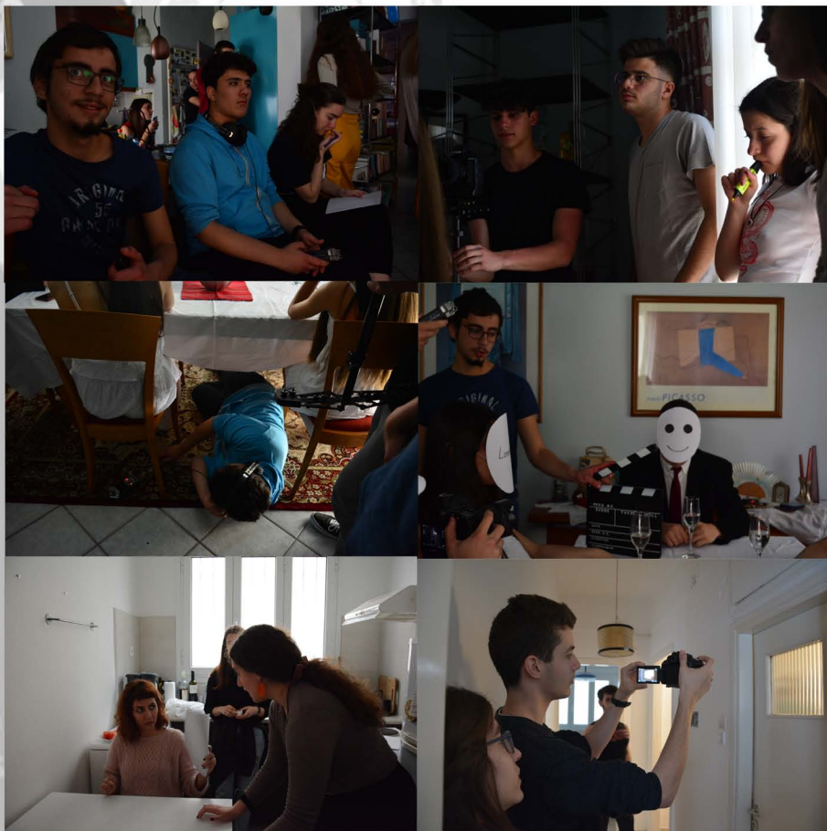
Πάνω και μέση: Γυρίσματα της ταινίας Εύπνημα Κάτω: Γυρίσματα της ταινίας Ειρκτής ;