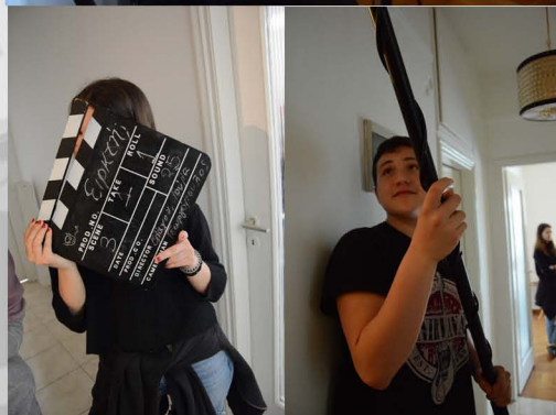
Από τα γυρίσματα της ταινίας Ειρκτή ;