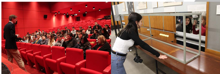
Πάνω αριστερά: Ακαδημία Κινηματογράφου του Μονάχου

Στη συνέχεια, πήγαμε μια βόλτα στα προπύλαια και στο κέντρο του Μονάχου και το απόγευμα επισκεφτήκαμε το Deutsches Museum, το μεγαλύτερο μουσείο επιστήμης και τεχνολογίας στον κόσμο, με περίπου 28.000 εκθέματα αντικείμενα από 50 πεδία επιστήμης και τεχνολογίας. Δέχεται περίπου 1,5 εκατομμύρια επισκέπτες ανά έτος. Στην επίσκεψή μας εκεί είδαμε, επιλεκτικά, την αίθουσα μαθηματικών, φυσικής και αστρονομίας.