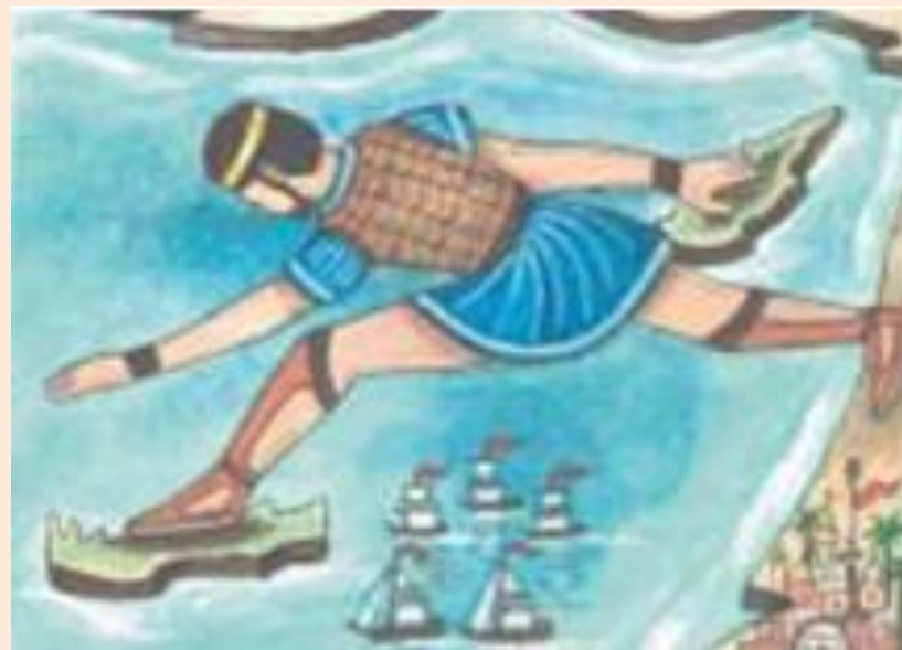
Ο Διγενής στην Κύπρο και στην Κρήτη

Στην Κύπρο, στον Πόντο, στην Κρήτη και σ' όλη την Ελλάδα μιλούν και τραγουδούν, ακόμη και σήμερα, για «της γης τον ανδρειωμένο», που είναι απόγονος του Ηρακλή, του Αχιλλέα και του Μεγαλέξανδρου, αλλά και πρόγονος του κλέφτη του 1821.