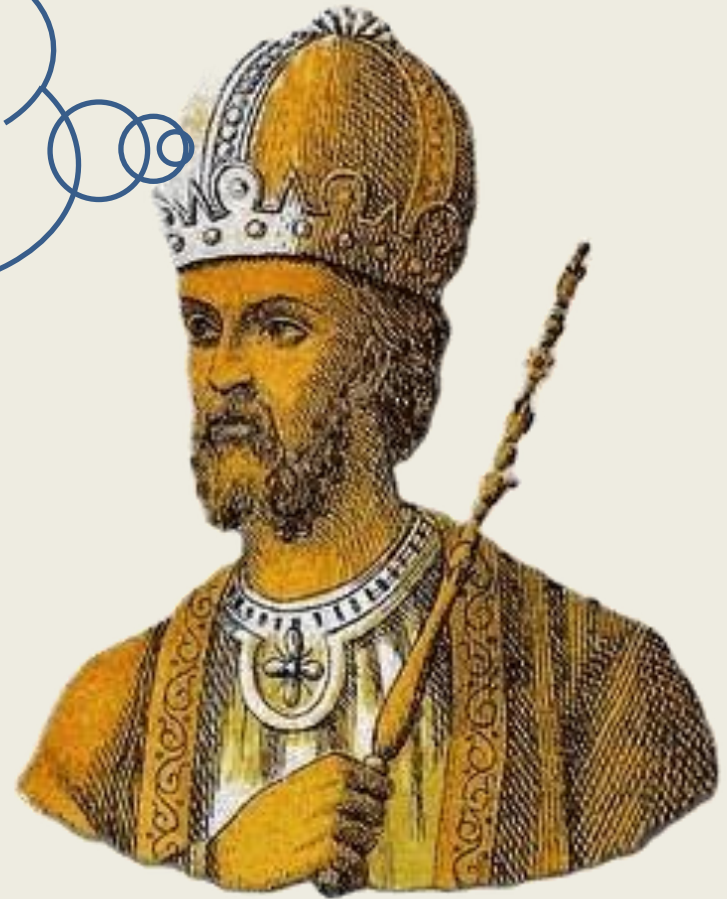
Λέων Γ' Ίσαυρος

Για να αντιμετωπίσω όλα αυτά τα προβλήματα πρέπει να κάνω αλλαγές στη διοίκηση του κράτους και στη νομοθεσία.