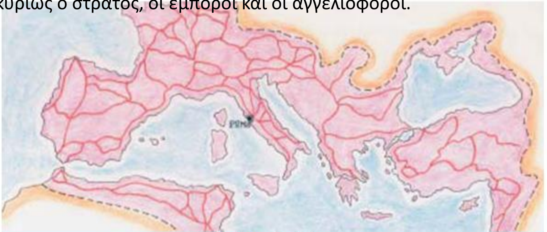
4.1. Οι ρωμαϊκοί δρόμοι

Στα χρόνια ακμής του ρωμαϊκού κράτους κατασκευάστηκε ένα πυκνό δίκτυο δρόμων, που ένωνε την πρωτεύουσα με όλες τις περιοχές της αυτοκρατορίας, τις μεγάλες πόλεις και τα λιμάνια. Ένας από αυτούς ήταν η Εγνατία Οδός. Ξεκινούσε από το Δυρράχιο, περνούσε από τη Βέροια, την Πέλλα και τη Θεσσαλονίκη και κατέληγε στο Βυζάντιο. Τους δρόμους αυτούς χρησιμοποιούσαν κυρίως ο στρατός, οι έμποροι και οι αγγελιοφόροι.