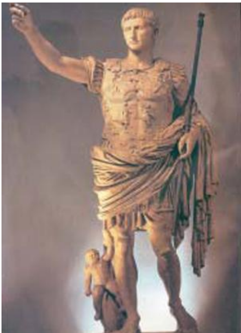
Ανδριάντας του αυτοκράτορα Αυγούστου (Μουσείο Βατικανού).

1. Όρισαν τον αυτοκράτορα «πρώτο πολίτη» της χώρας κι όλοι όφειλαν πίστη και υπακοή σ' αυτόν.