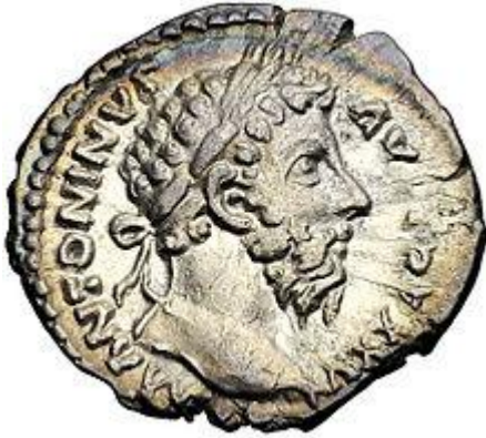
Δηνάριο του Μάρκου Αυρήλιου . Πηγή : wikipedia