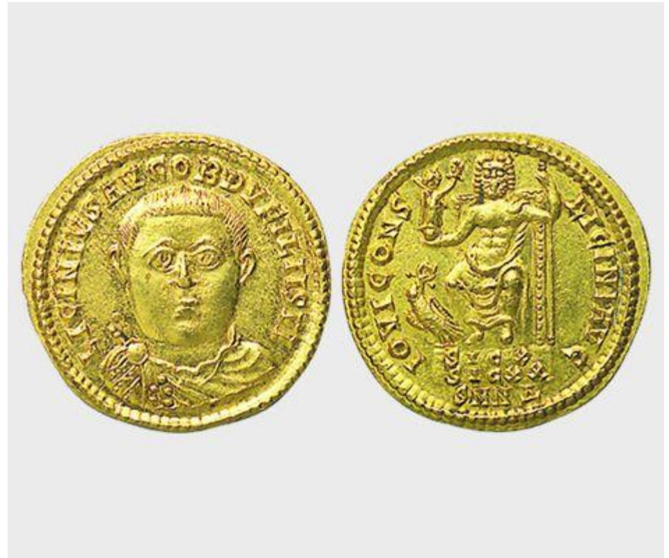
Aureus Λικινίου Α΄, 308-324 μ.Χ.